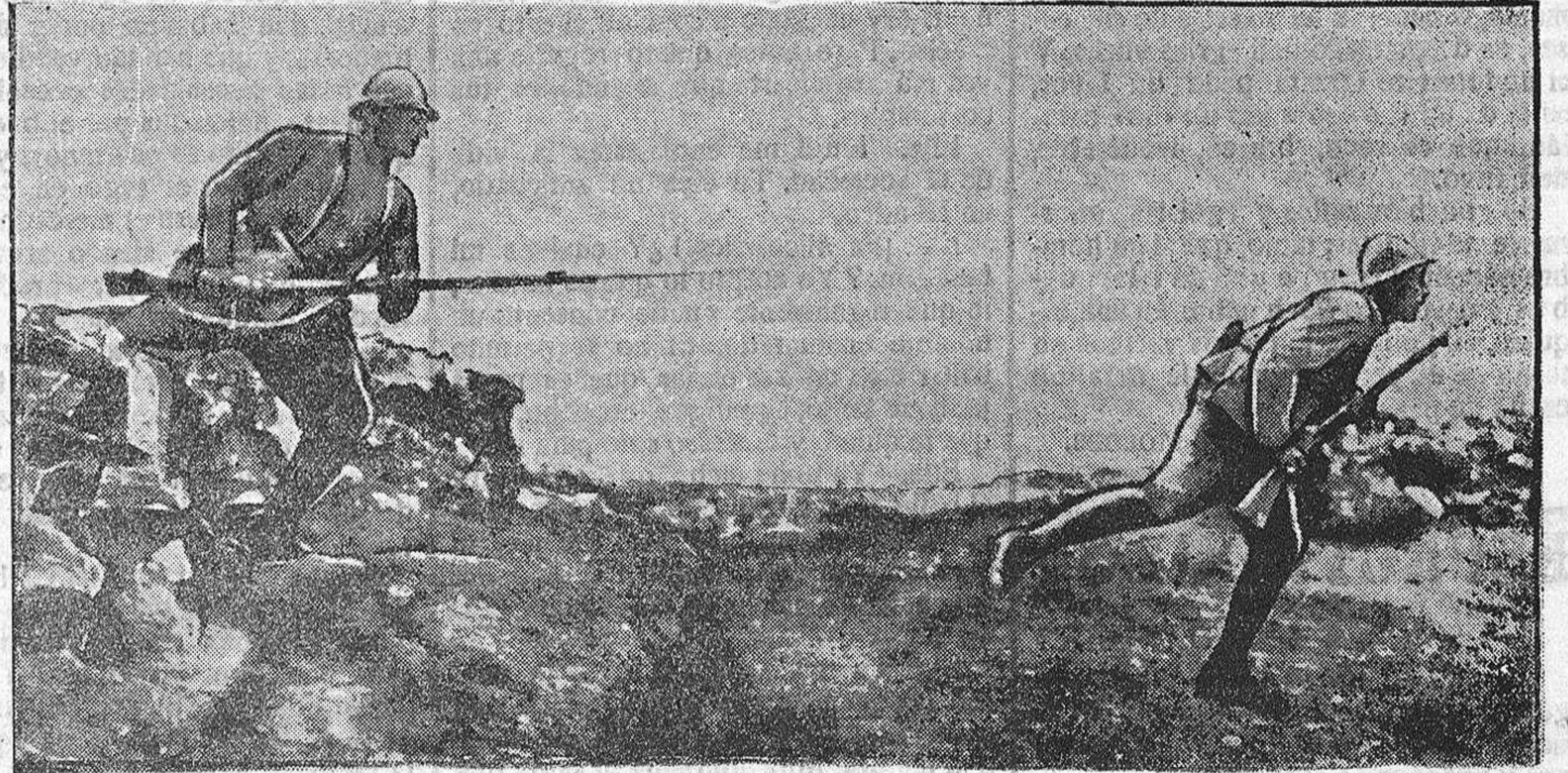
Un asalto realizado por las tropas francesas en el frente de Verdún.