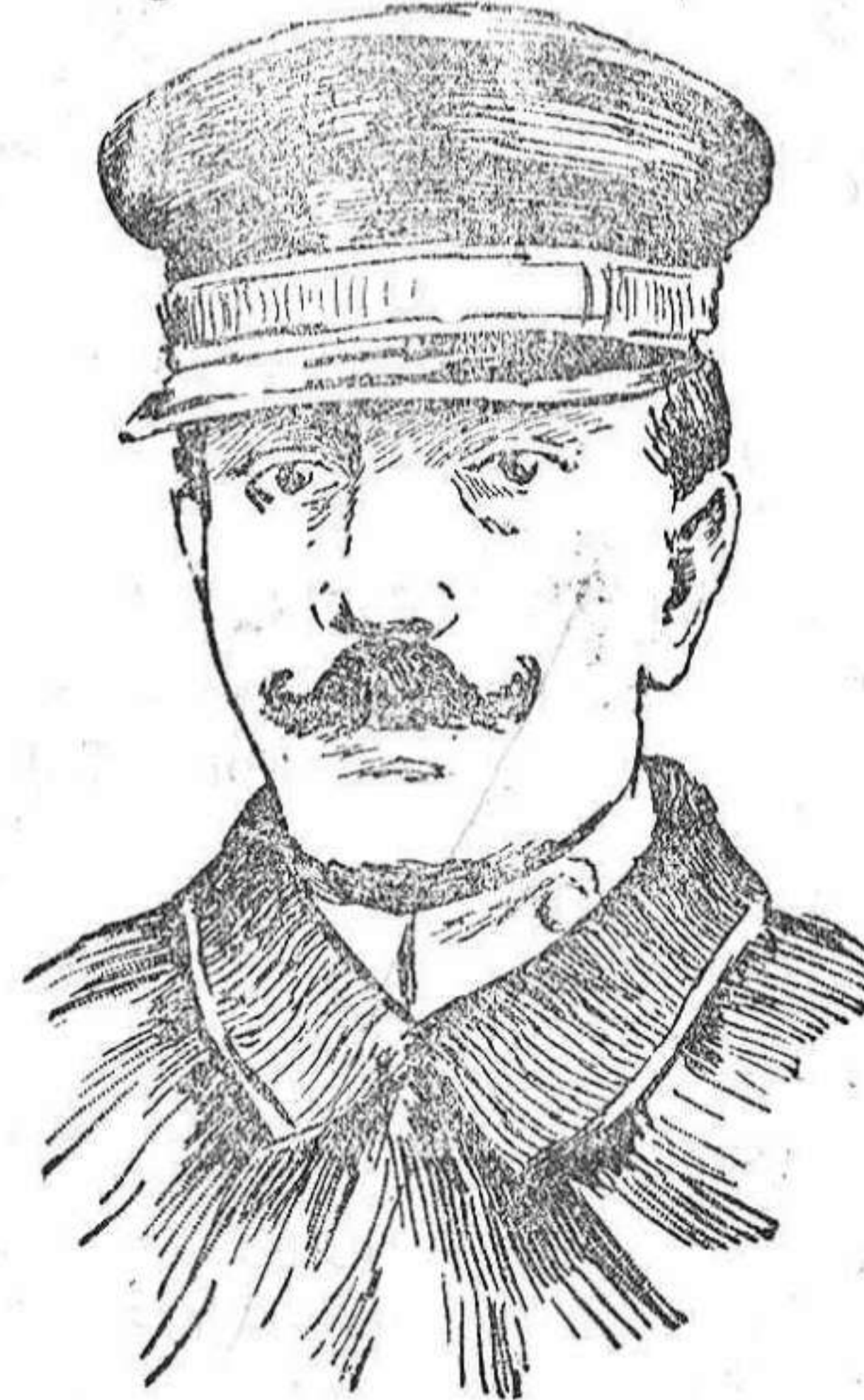
General Mosechopoulos, jefe dimisionario del Estado Mayor del ejército griego.