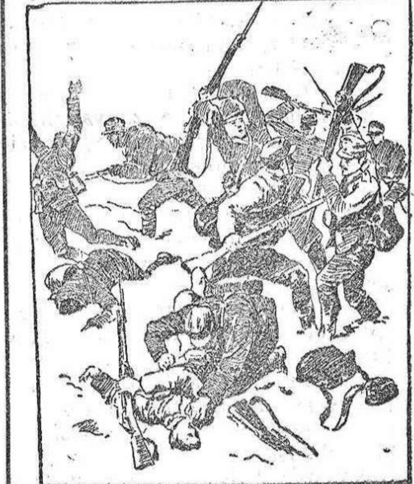
Un encuentro cuerpo a cuerpo entre soldados austro húngaros e italianos en Monte Boston.