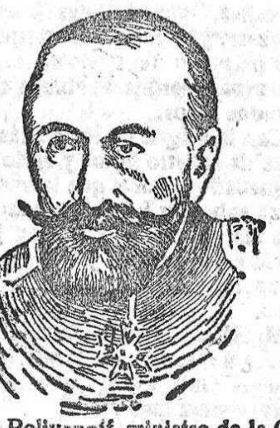
General Polivanoff, ministro de la Guerra de Rusia, a quien se dedica por el cargo de generalísimo.

Quedan 6 soldados sin distribuir. Resumen.—Península: La Caja de Toro da a la primera región 6; a la sexta 44; a la séptima 111. Total, 161. A África da 37 a Ceuta; 45 a Méjico y 9 a Larache. Total, 91, y a las unidades expedicionarias, 61.