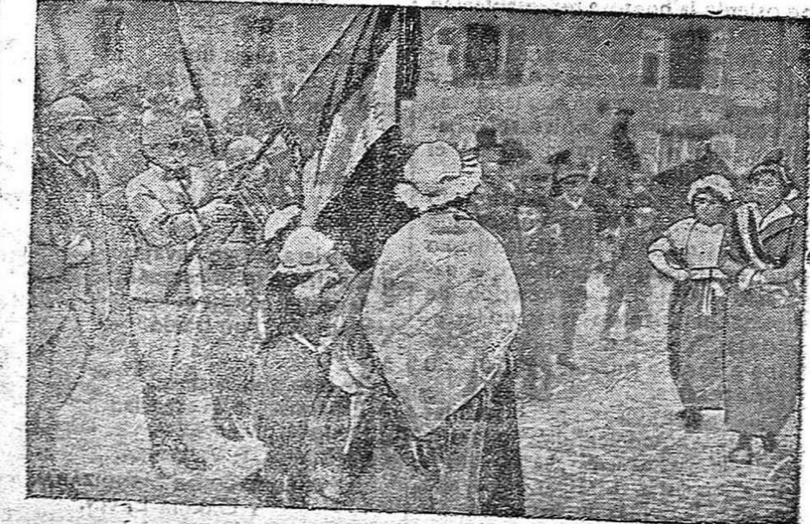
DE LA GUERRA.—Desfile del primer regimiento extranjero en Chateau Sahin.