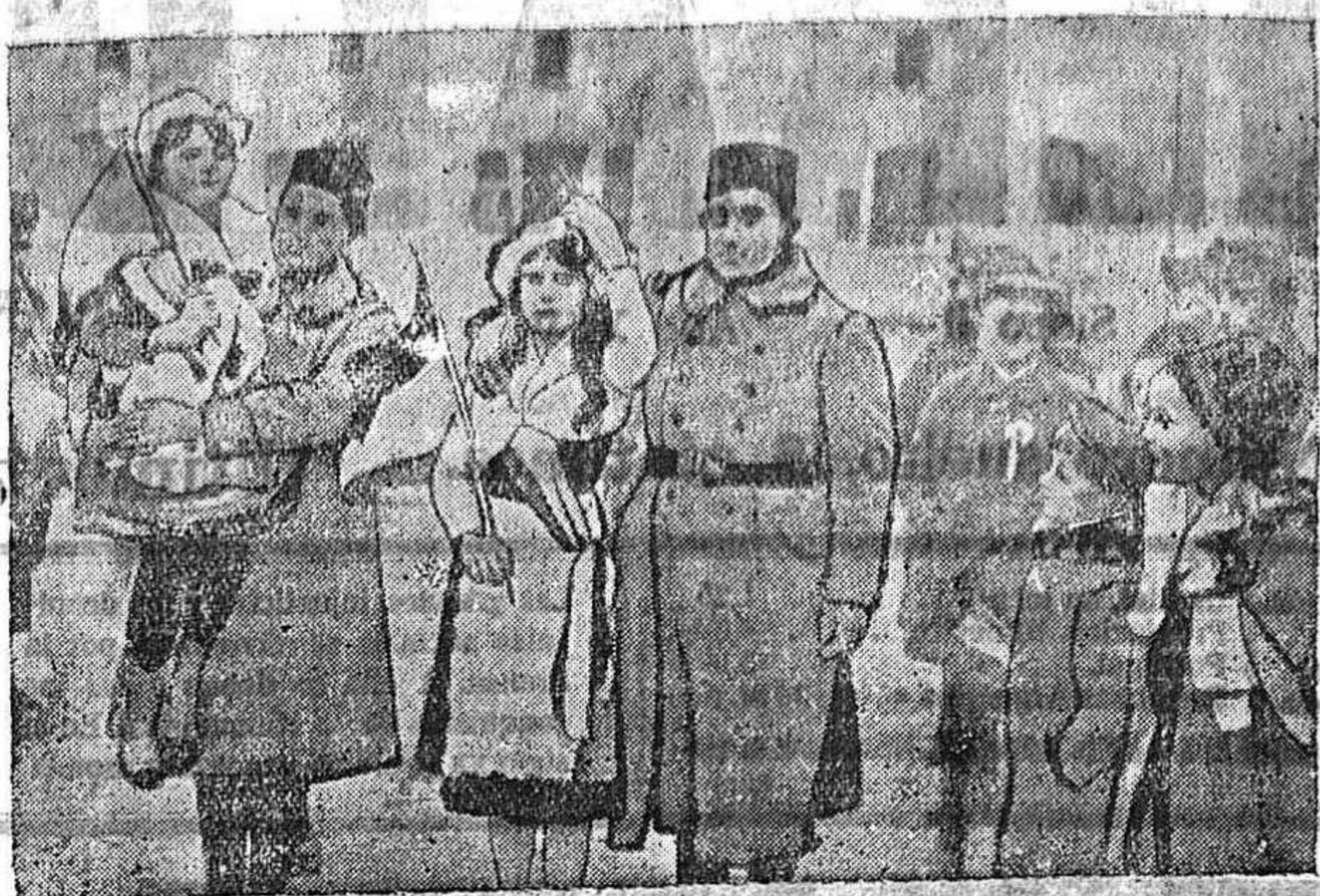
DE LA GUERRA.—Soldados franceses y jóvenes baronesas en Chateau Sahin.