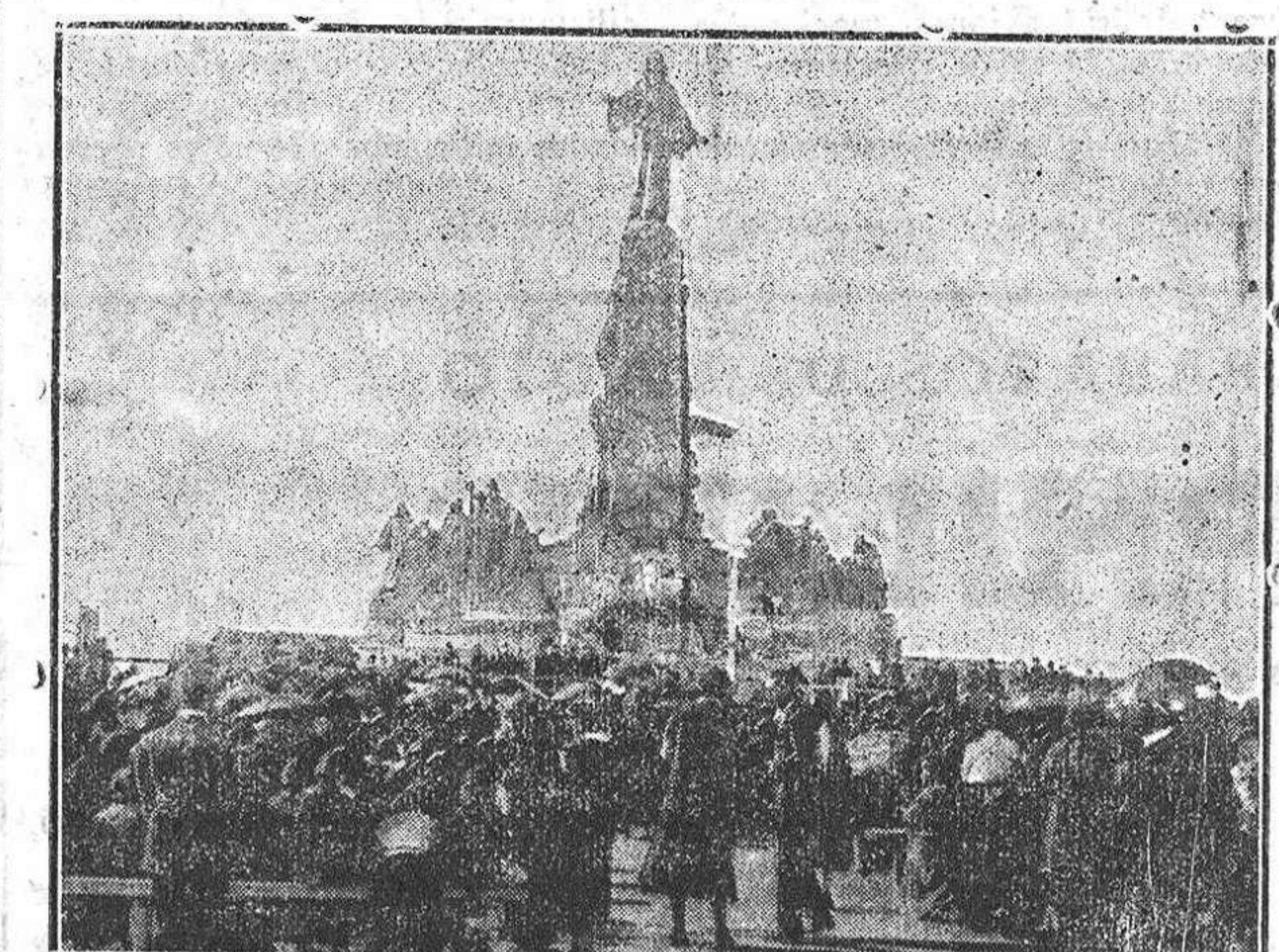
Las hordas rojas se desbordaron, haciendo objeto de su infame ensañamiento a la bendita imagen que un día erigió la catolicidad española. Otra vez Cristo Rey vuelve a reinar entre nosotros y su imagen será faro que en el centro de España alumbrará las páginas de nuestra gloriosa historia