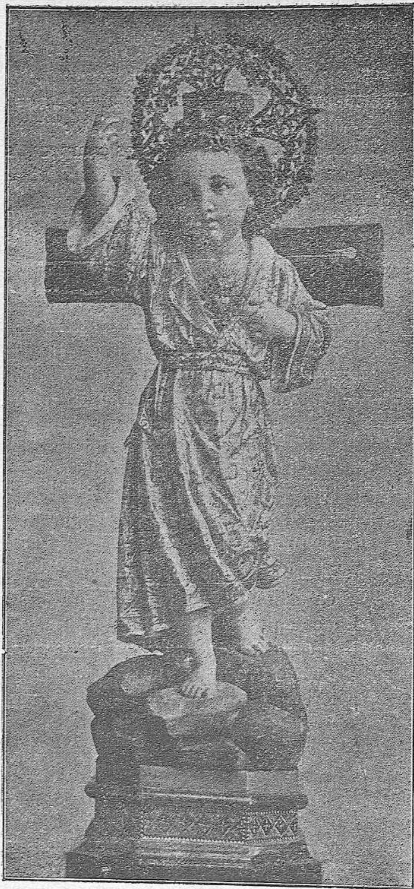
EL NIÑO JESÚS