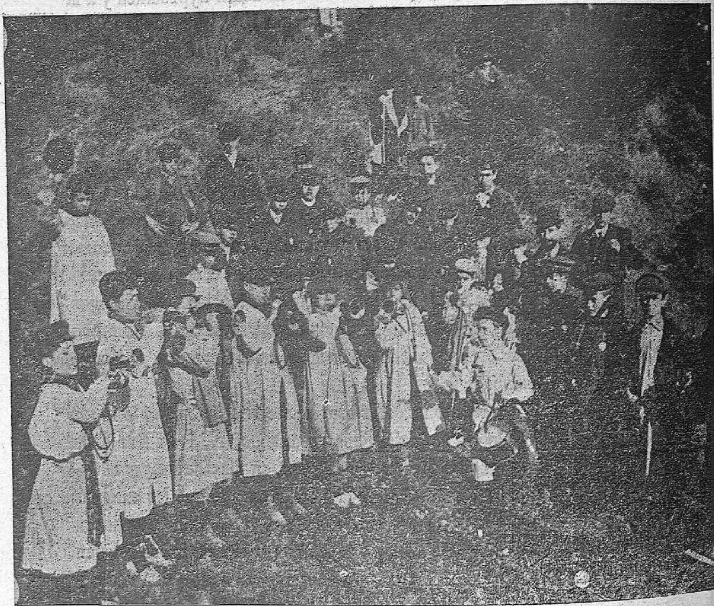
Banda de tromperas del Centro de Ntra. Sra. del Carmen y S. Pedro Claver—Barcelona