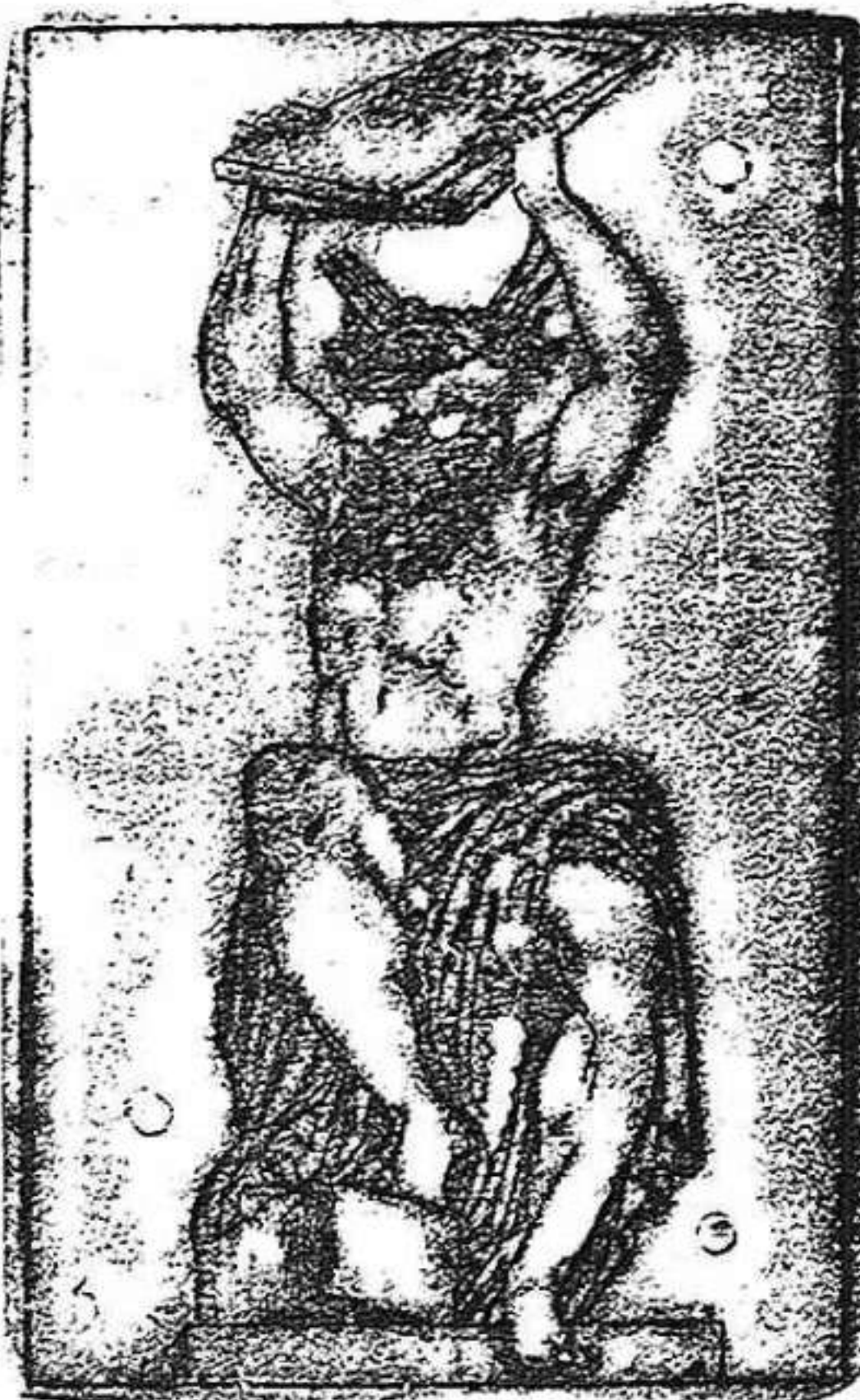
Moisés rompiendo las tablas de la Ley

Esta obra, que se conserva en Parma, es una de las joyas que salieron del pincel de Mazzuoli (El Parmesano). Representa el momento en que Moisés al bajar del Sinaí, rompió las tablas de la Ley, en vista del becerro de oro que Aarón había erigido durante su ausencia.