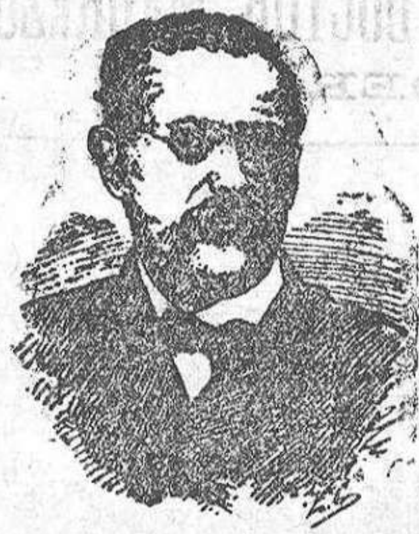
JOSÉ ANSELMO CLAVÉ

Nació en Barcelona en 1824—fue en la misma ciudad en 1874.