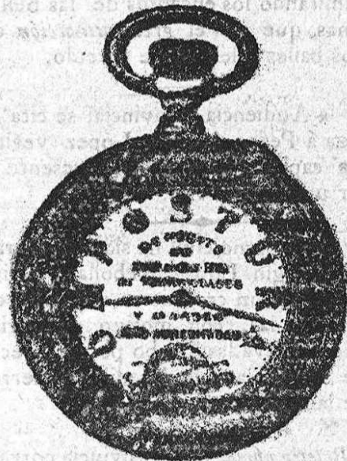
Relojes Mored, pendulos y Reguladores.