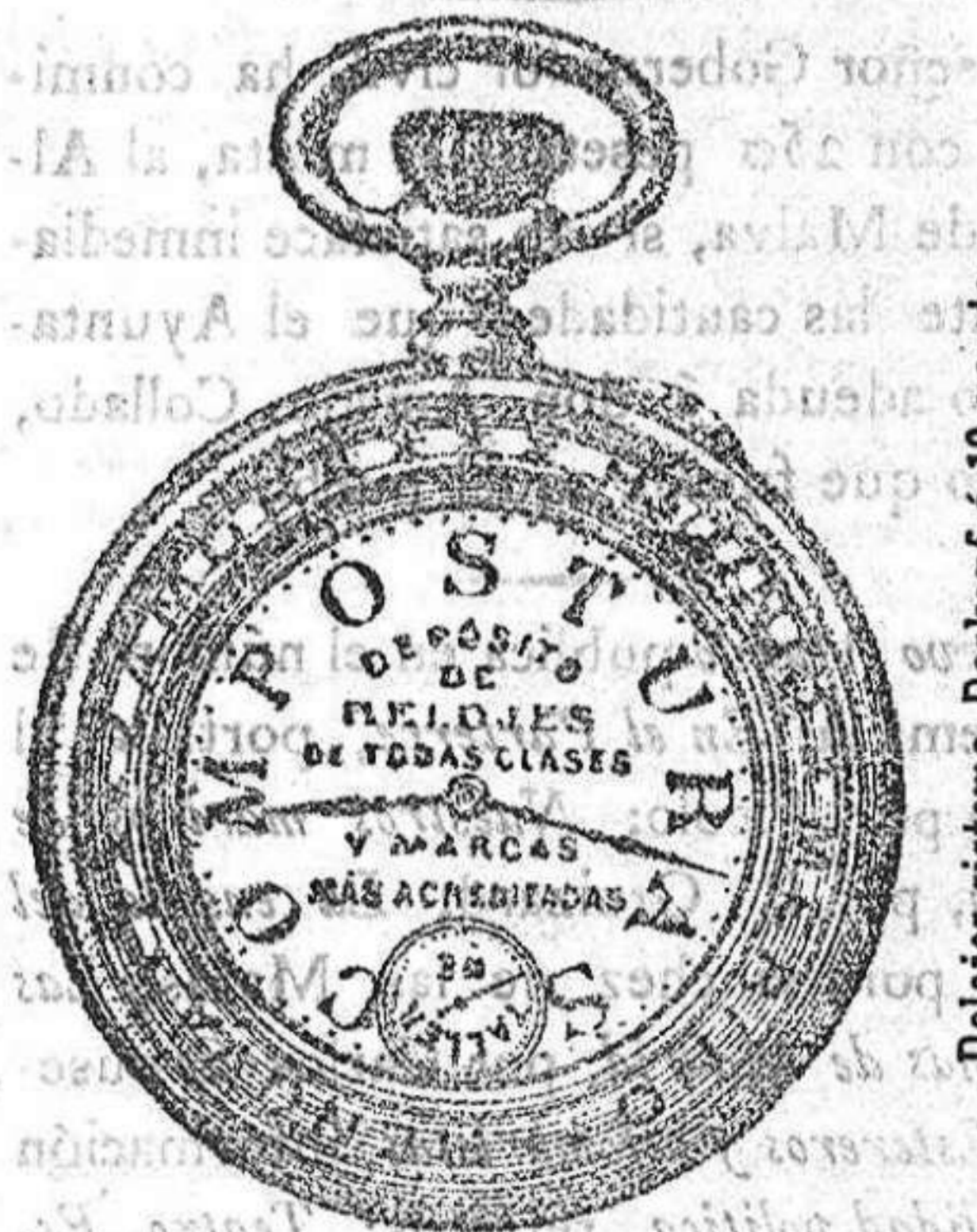
Relojes Mored, péndulos y Reguladores.