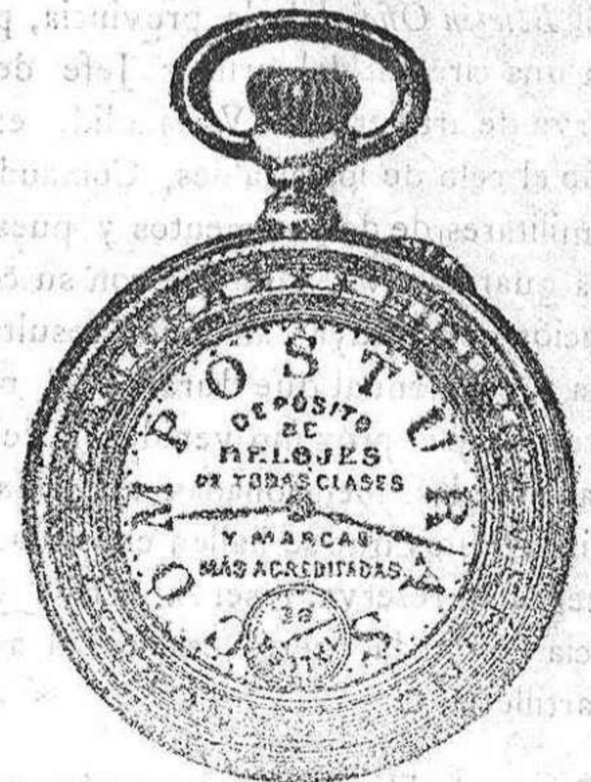
Relojes Merino, pendulos y Reguladores.