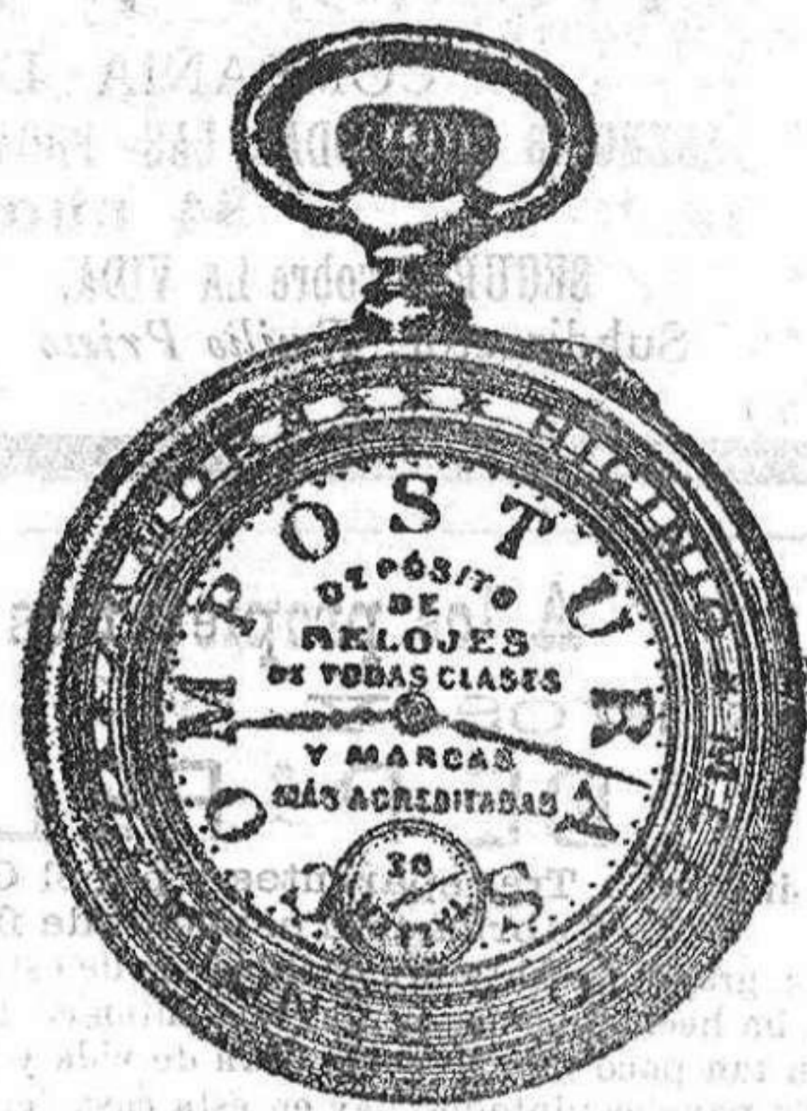
Relojes Mored, péndulos y Reguladores.