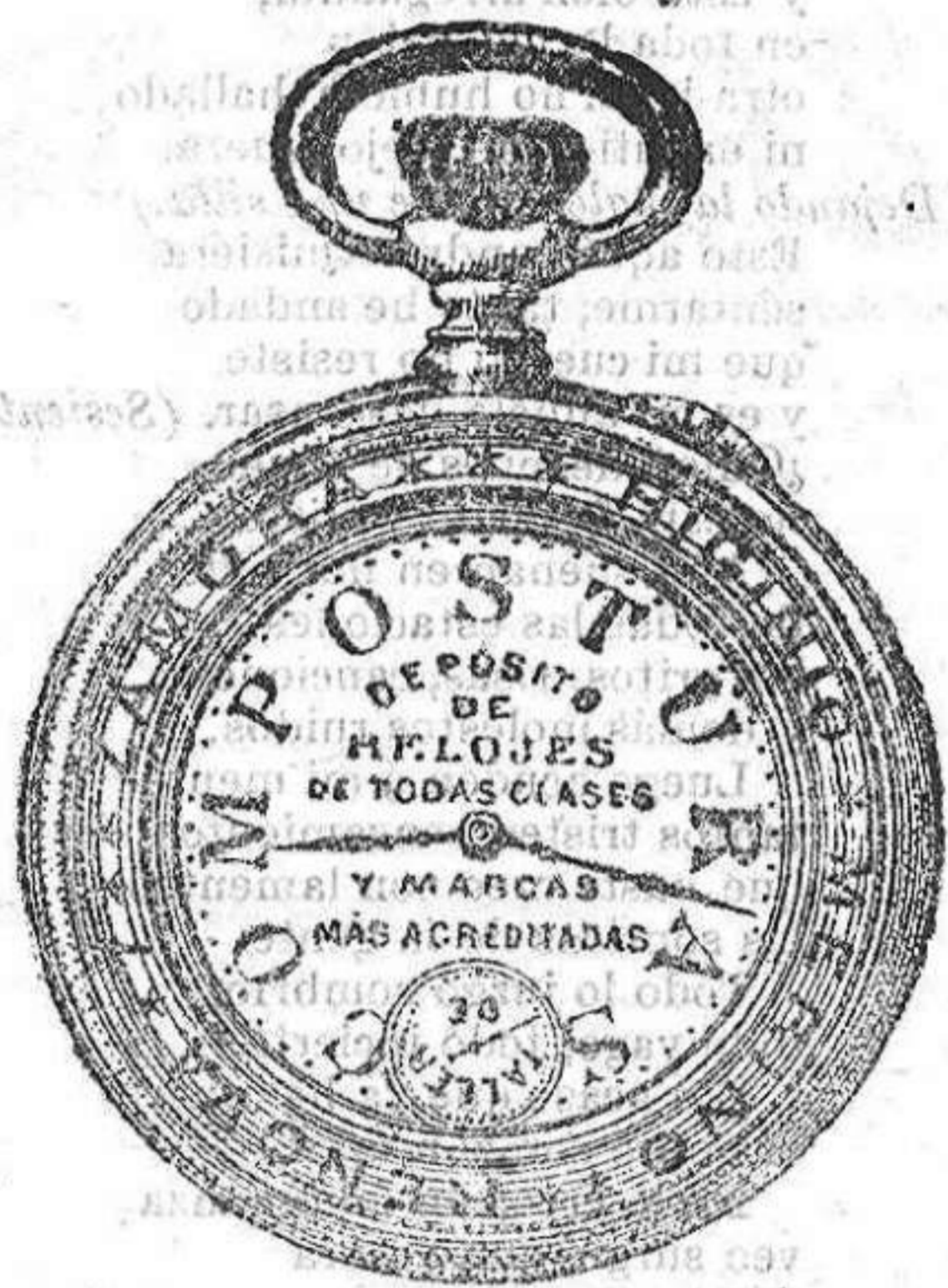
Relojes Mored, péndulos y Reguladores.

HIGINIO MERINO RELOJERÍA Y ÓPTICA 5, Renova, 5.