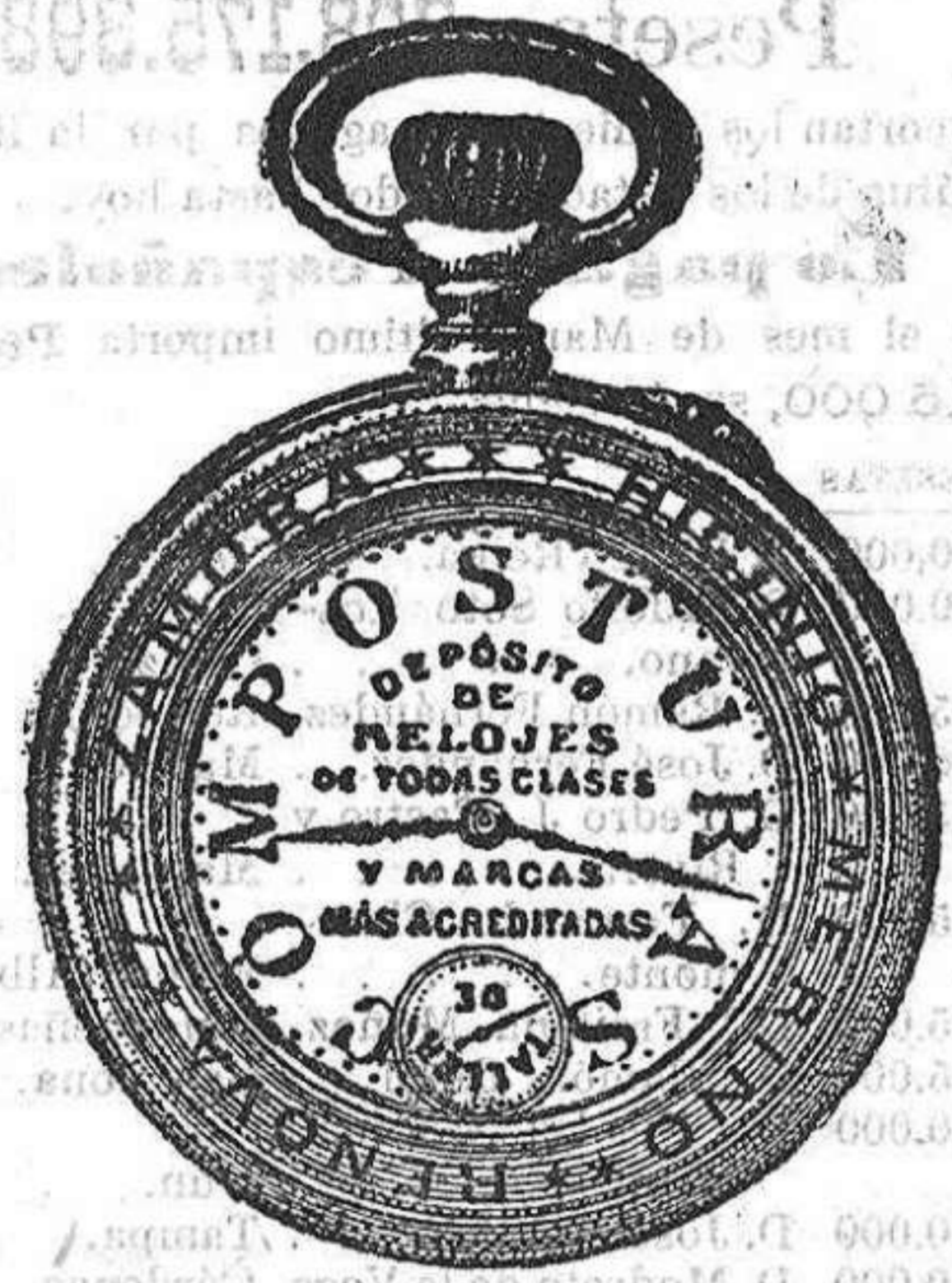
Relojes Mored, péndulos y Reguladores.

HIGINIO MERINO RELOJERÍA Y ÓPTICA 5, Renova, 5.