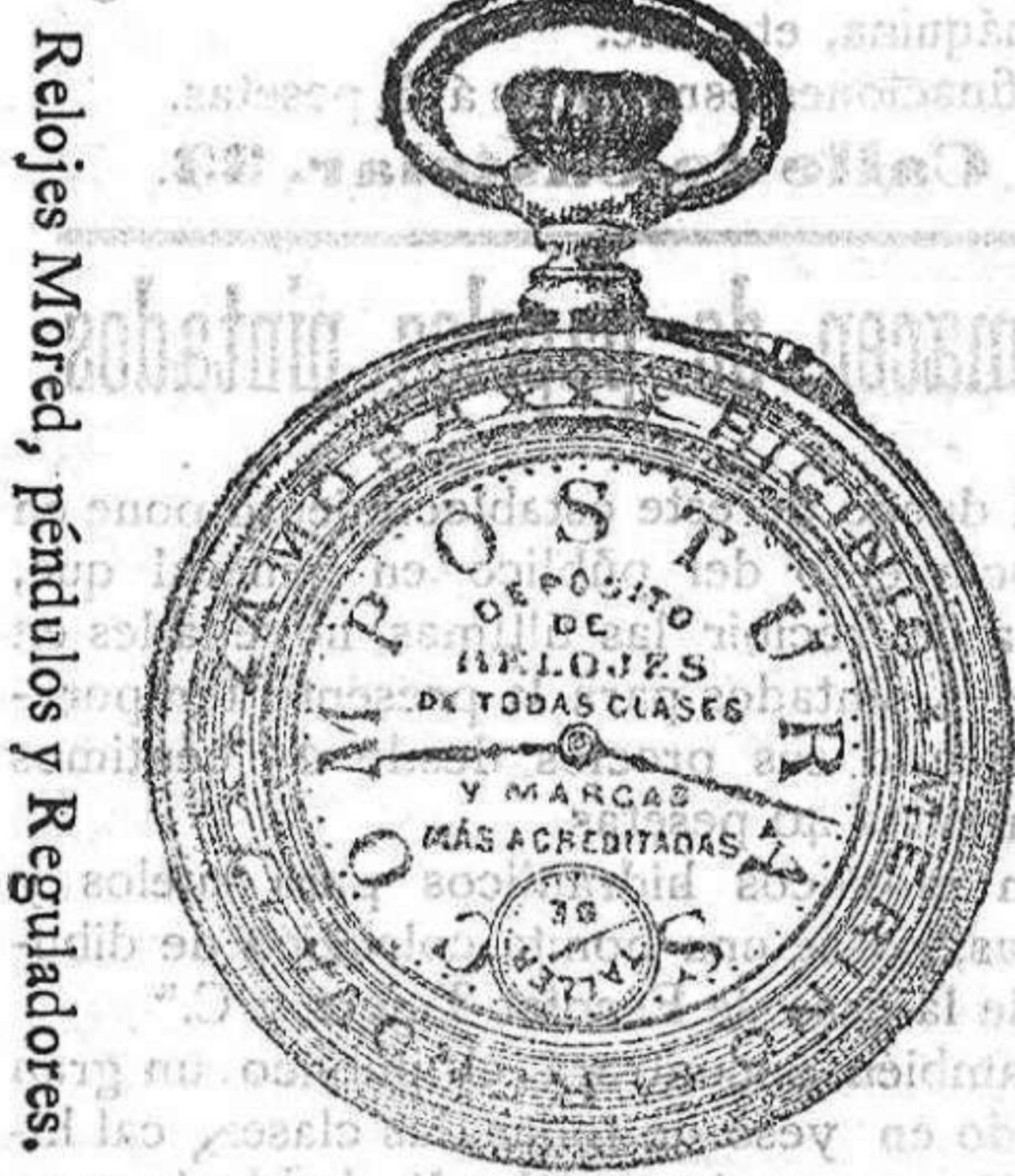
Relojes sistema Roskopf á 12 pesetas.

Los relojes de esta casa que no marchen bien se cambian. Cristales roca y París. Armaduras de todas clases y modelos. Lentes y gafas para vistas enfermas. Cristales periscopicos, Termómetros, Varómetros etc. Para mayor seguridad del cliente, esta casa cuenta con el Octómetro, y el Esferómetro, únicos aparatos que gradúan con exactitud la vista y los cristales, é indispensables en esta clase de establecimientos. Se hacen toda clase de reparaciones en aparatos de Óptica y Física.