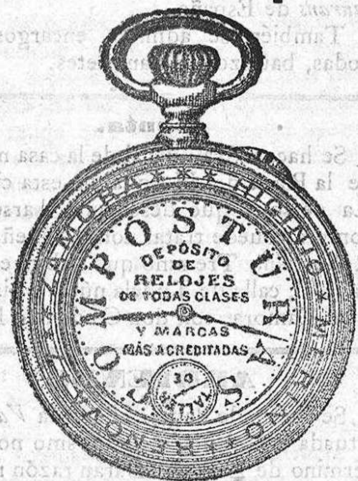
Relojes Mored, pendulos.