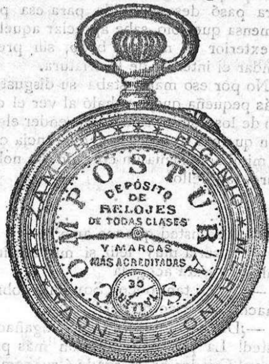
Relojes Mored, péndulos, Reguladores y Cuartos.

Extraordinario surtido en cadenas de todos los modelos. Relojes Sistema Roskopf á 12 pesetas!!