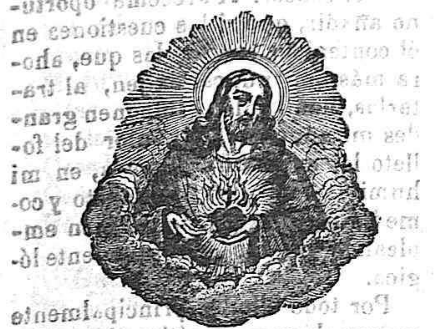
EL SAGRADO CORAZÓN DE JESUS PANAL DE MIEL

¿Quién pagará los vidrios rotos? ¿Los inquilinos? ¿El casero? Voto porque sea éste quien los pague. ¿Que se trata de