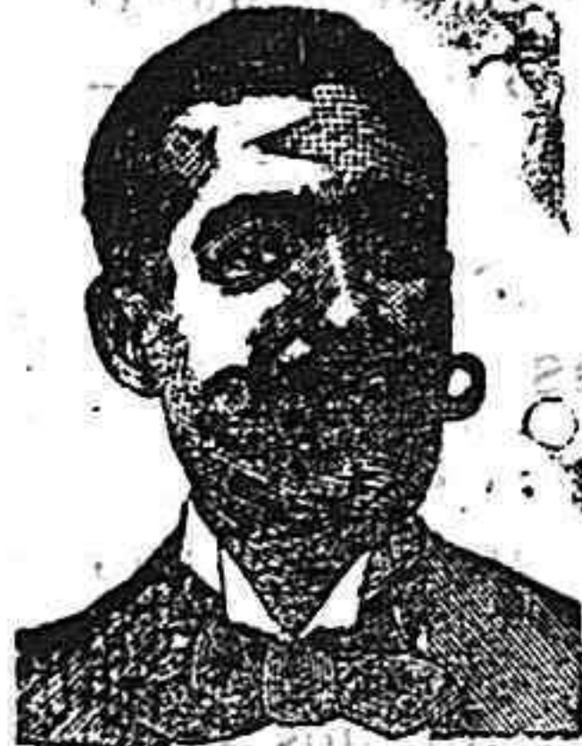
A. SALVATI COSTANZI Calle Diputación, 435 BARCELONA

Venta al por mayor y menor: Farmacia Giol, Paseo de Gracia, 24.-Barcelona.