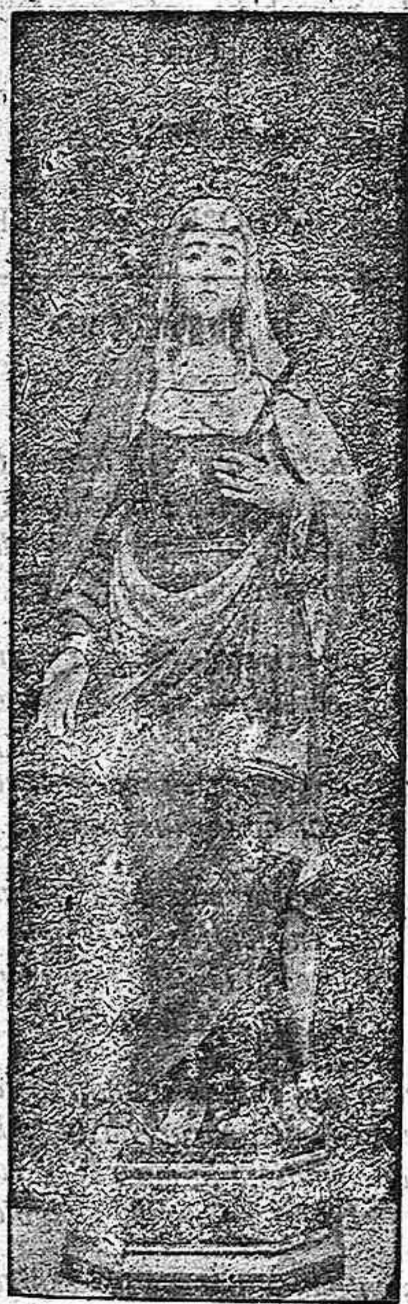
María Al Pié de la Cruz