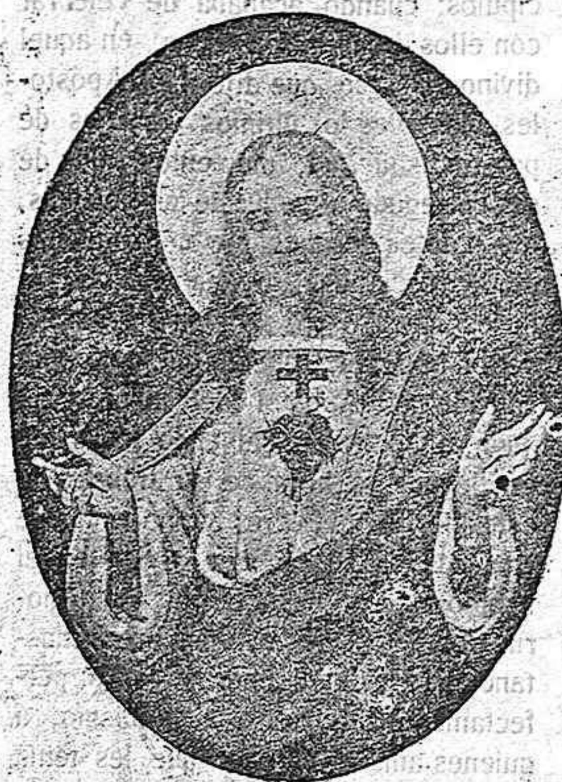
LANZADA DE JESÚS

Pendía el divino Salvador, clavado en la cruz sobre el monte Calvario, mostrando triste y dolerosa figura. Su rostro que antes resplandecía con lumbr del cielo estaba cárdeno y amaratado, sus ojos claros y purísimos, oscurecidos y difuntos, y su cuerpo sacratísimo que despedía de sí gloria y magestad, se veía todo llagado y envuelto en sangre seca y ennegrecida.