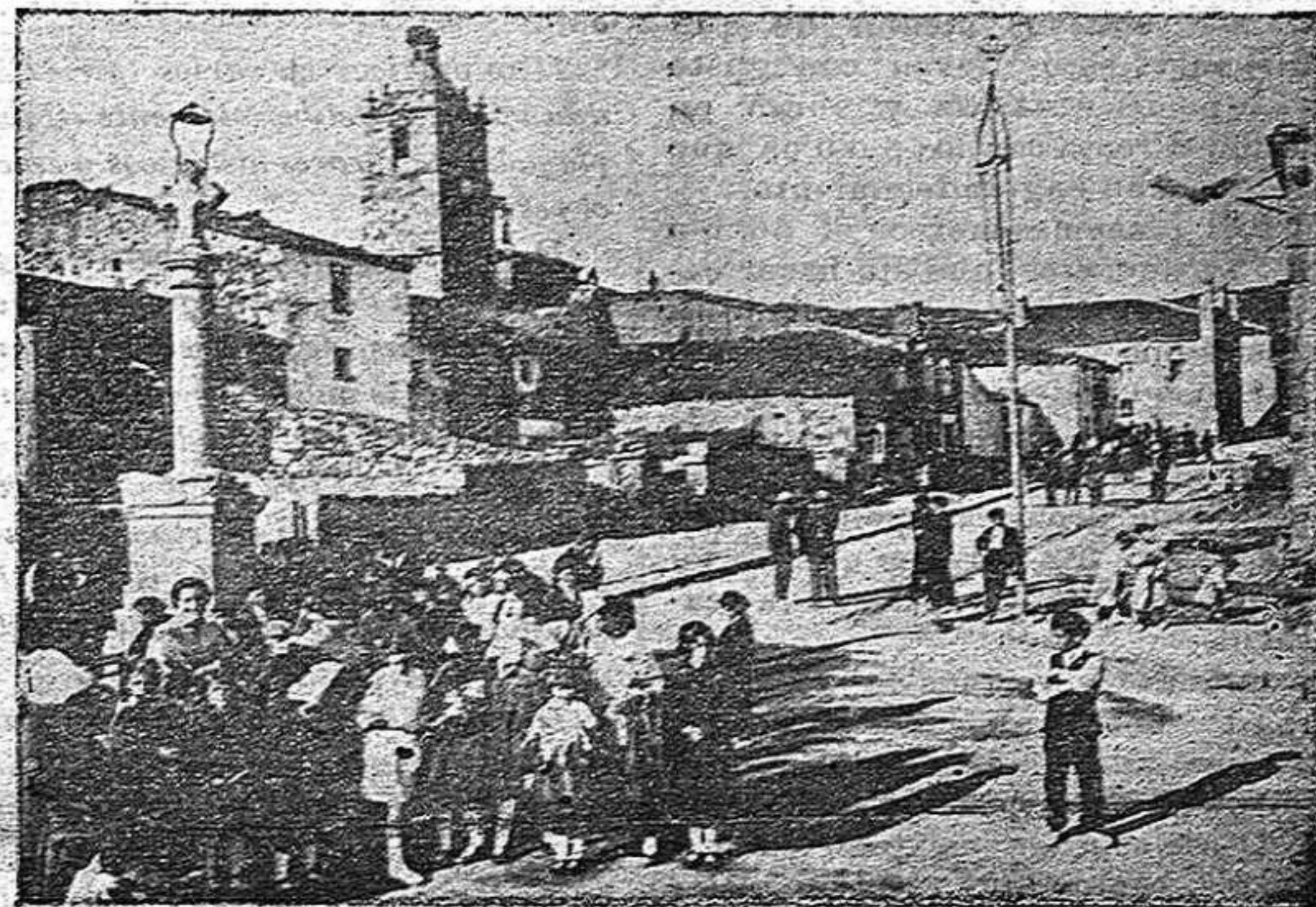
EL ROYO.—La Plaza del rollo en día de fiesta

Desde su fundación hasta la fecha La Sociedad filantrópica de El Royo y Derroñadas lleva remitido a sus respectivos pueblos un capital de 150.000 pesetas y hoy cuenta en caja en efectivo con 25.000 pts., y la recaudación anual es de unas 6.500.