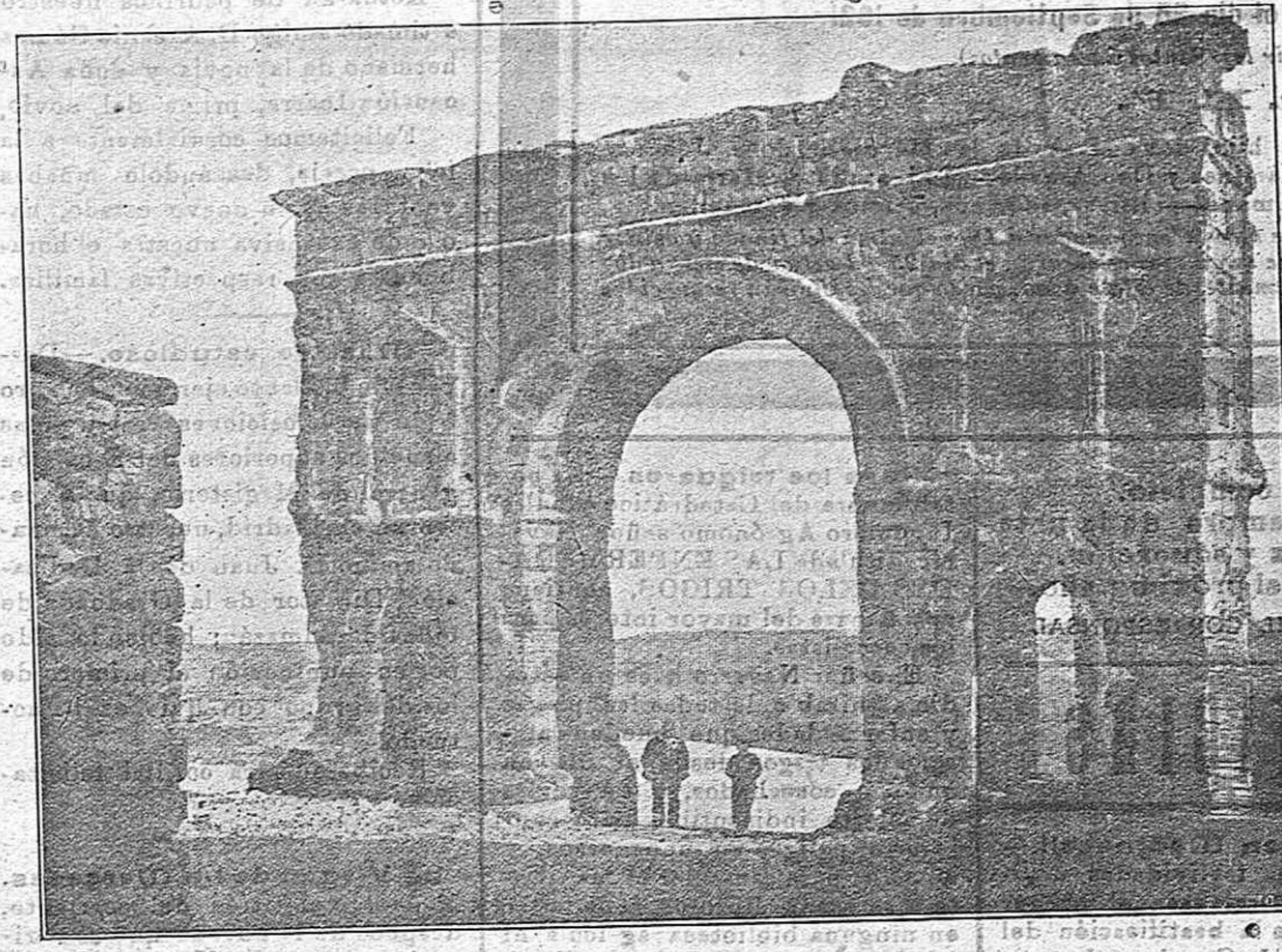
Arco del Triunfo de la histórica villa de Medina del Campo, en donde se celebrarán grandes festejos durante los días 25, 26 y 27 del corriente con motivo de la beatificación del Beato Julian de San Agustín.

No sabemos lo que nuestra Diputación, nuestras entidades, nuestros Ayuntamientos y nuestras fuerzas vivas habrán pensado hacer ante el proyecto que nos ocupa. Seguramente a estas horas tendrán ya proyectado un plan de campaña. Urgente, urgentísimo es desarrollar ese plan si está formado, o formarlo si todavía no se ha hecho, y llevarlo a la práctica. LA VOZ DE SORIA, ahora, como siempre que se ha tratado del bien de la provincia o de los intereses de la Nación, se pone a la disposición de las Corporaciones y entidades de la Provincia, en este asunto esperando sus indicaciones para inmediatamente secundarlas.