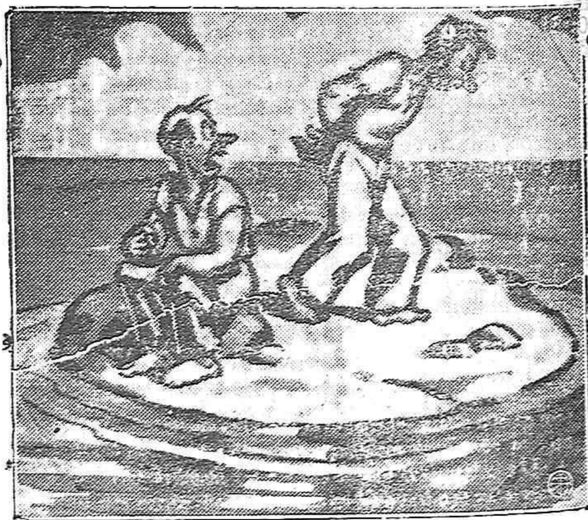
(El médico a su compañero de naufragio) Eso se le quita dando grandes paseos.

Enfermedades de los ojos A. PEREZ TOMAS Médico - Oculista CANALEJAS, 5, pral. Teléfono 116