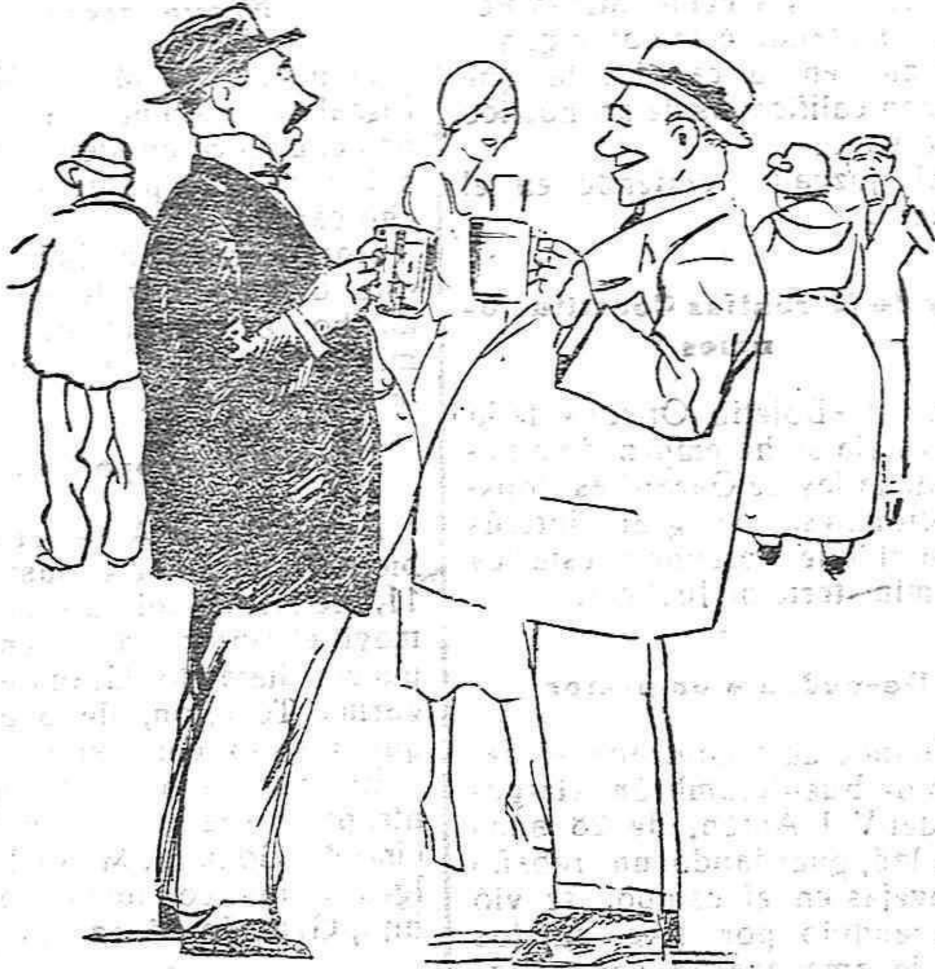
—Estas aguas son milagrosas contra la obesidad. Hace una semana no podíamos acercarnos tanto.