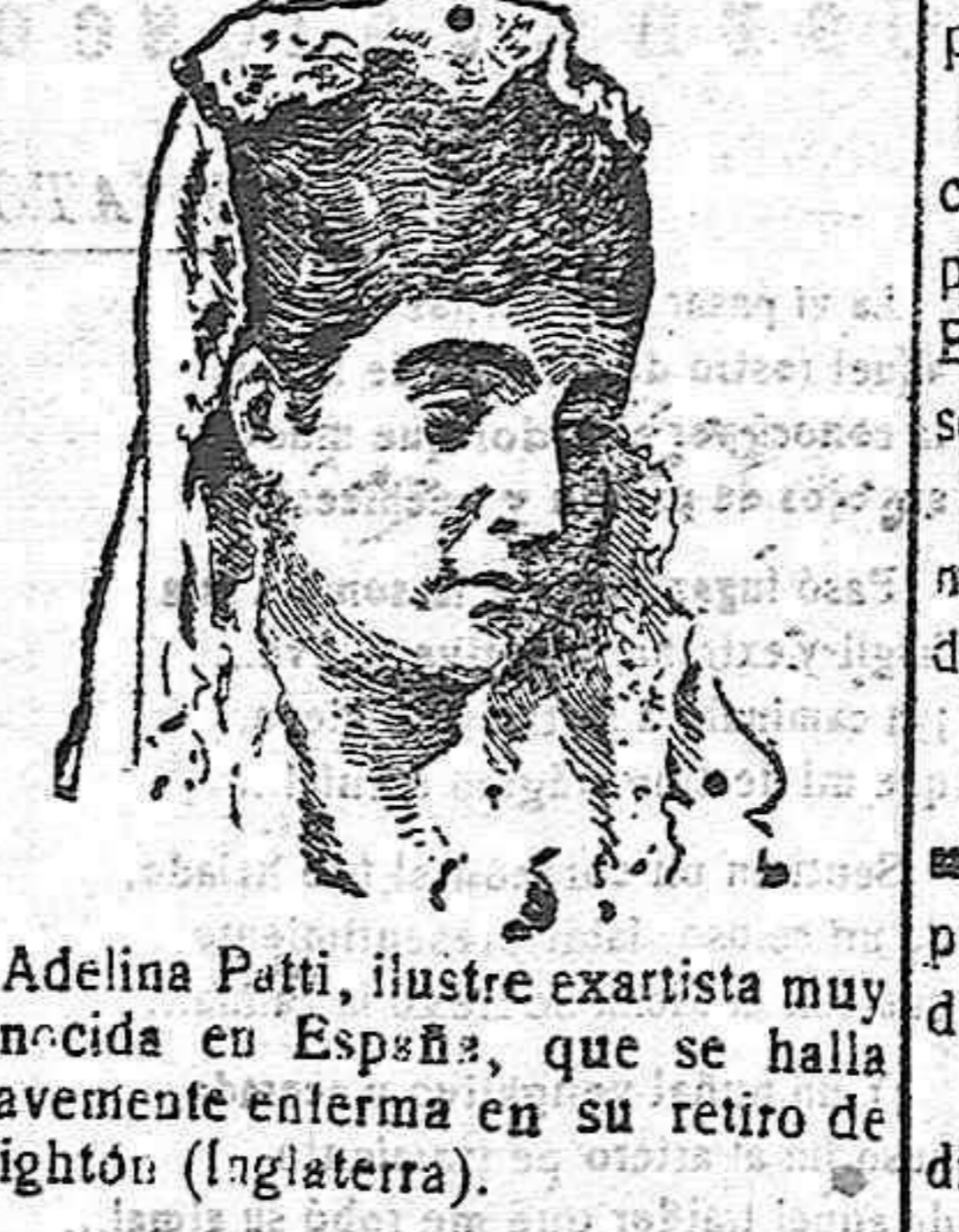
Adelina Patti, ilustre exartista muy conocida en España, que se halla gravemente enferma en su retiro de Brighton (Inglaterra).