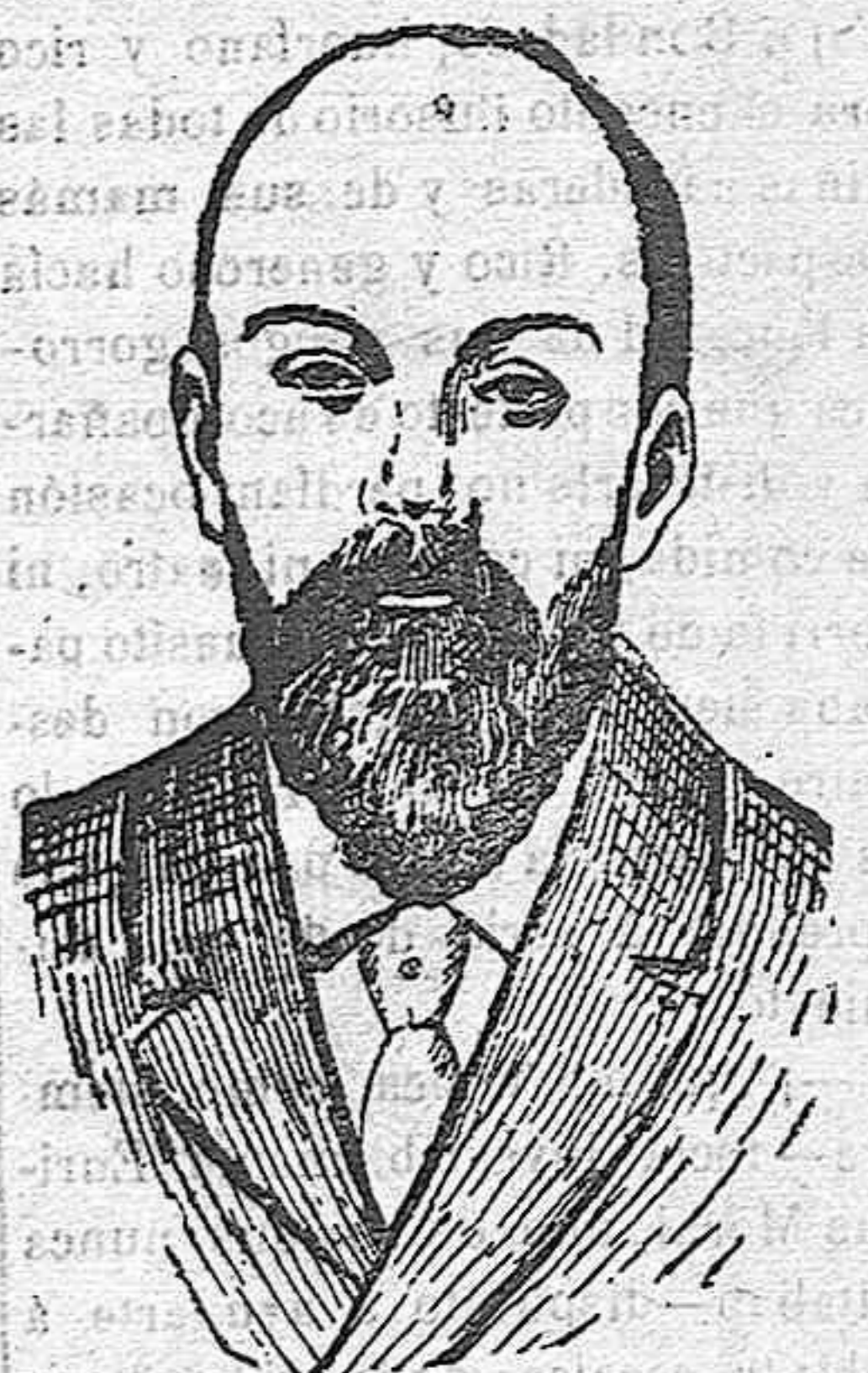
Nicolashvitch Ulvanow, «Lenine» famoso jefe ruso del partido bolchevickista.