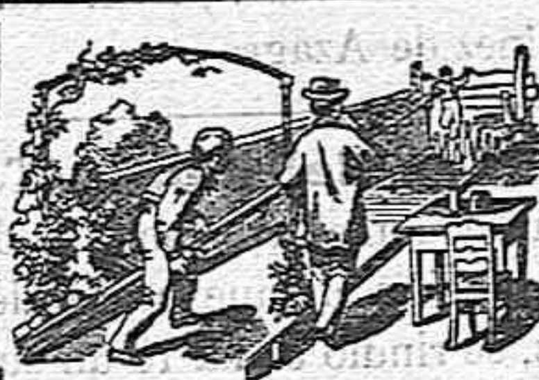
SPORT. Bolos alemanes.