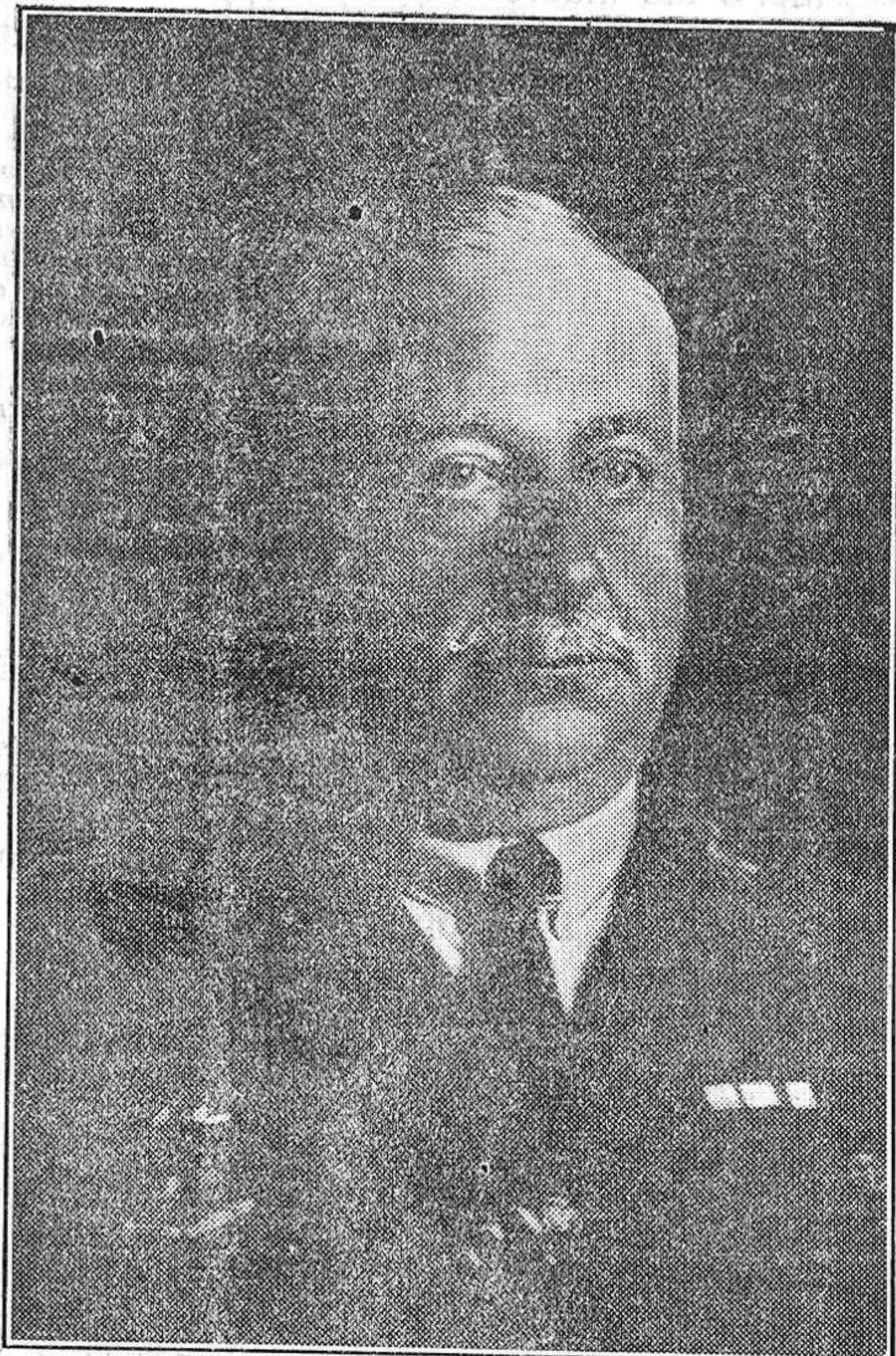
Excmo. Sr. D. Miguel Primo de Rivera

Hombre que sacrificó todo, hasta su propia vida, por salvar á su Patria, dando nota de continua y desinteresada preocupación en bien de ella, que podía resumir su política, en orden, moralidad, justicia y honor, para hacer su rege-