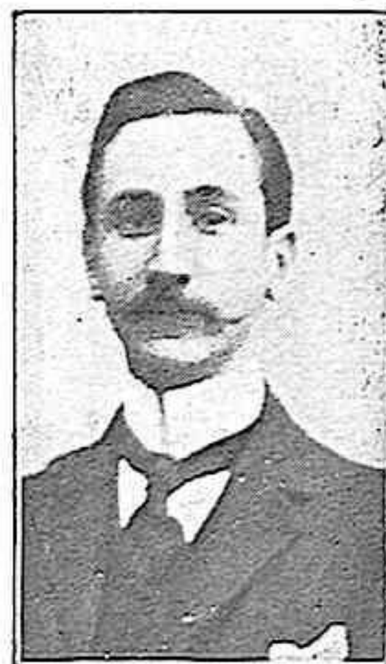
SR. VIZCONDE DE EZA

En las Cortes figura desde 1899, que fué Diputado por primera vez por Soria, y el mismo distrito lo reeligió para las siguientes: 1899, 1901, 1903, 1905 y 1907. En esas últimas presidió varias Comisiones que entendieron en asuntos de la especial competencia del Sr. Vizconde, tales como colonización y repoblación interior, plagas del campo y repoblación forestal y conservación de montes. También presidió las Comisiones de los pro-