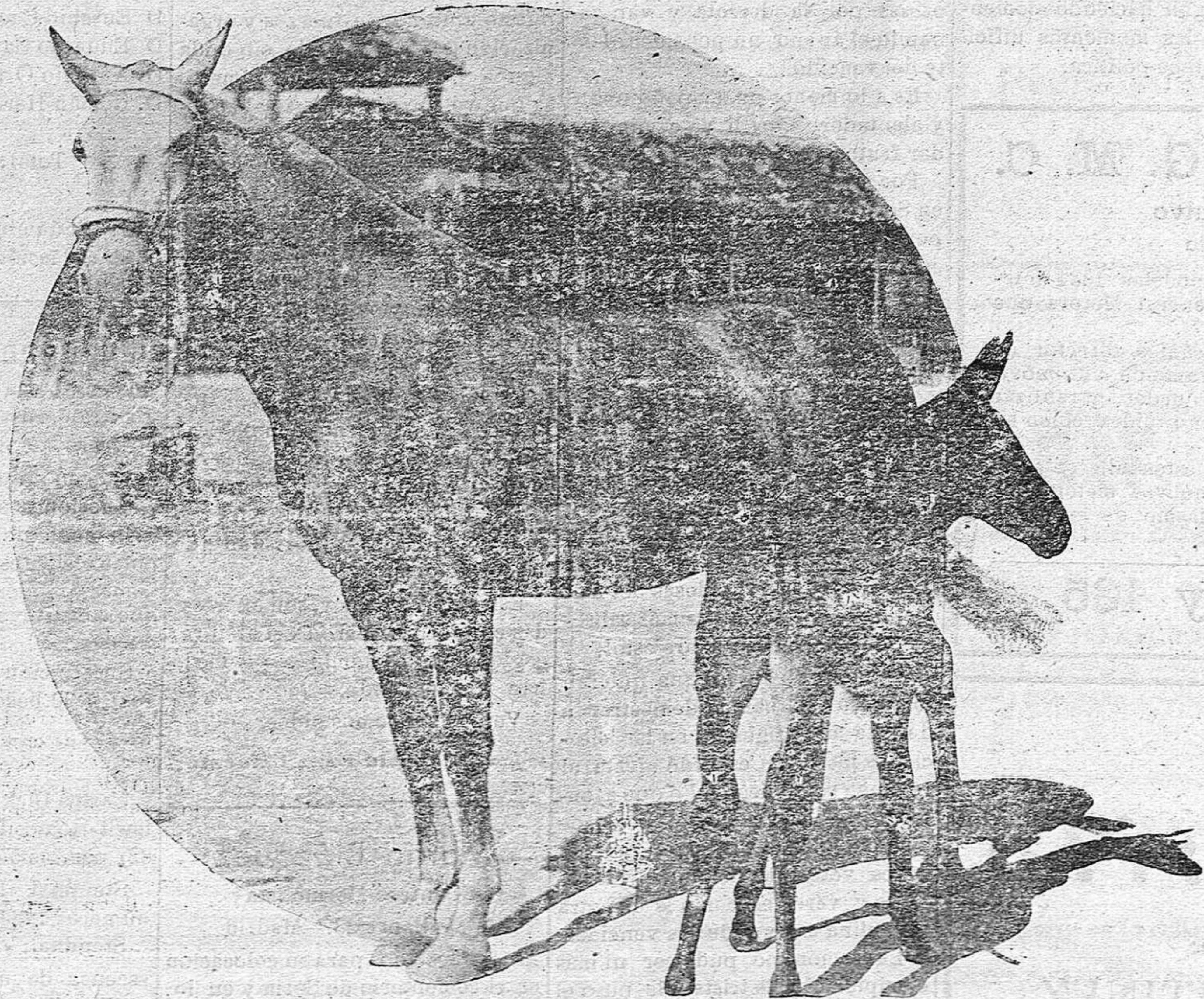
Esta yegua, propiedad de un prestigioso ganadero de Albacete, alcanzó el primer premio en un Concurso de Ganados celebrado con brillante éxito en dicha capital.