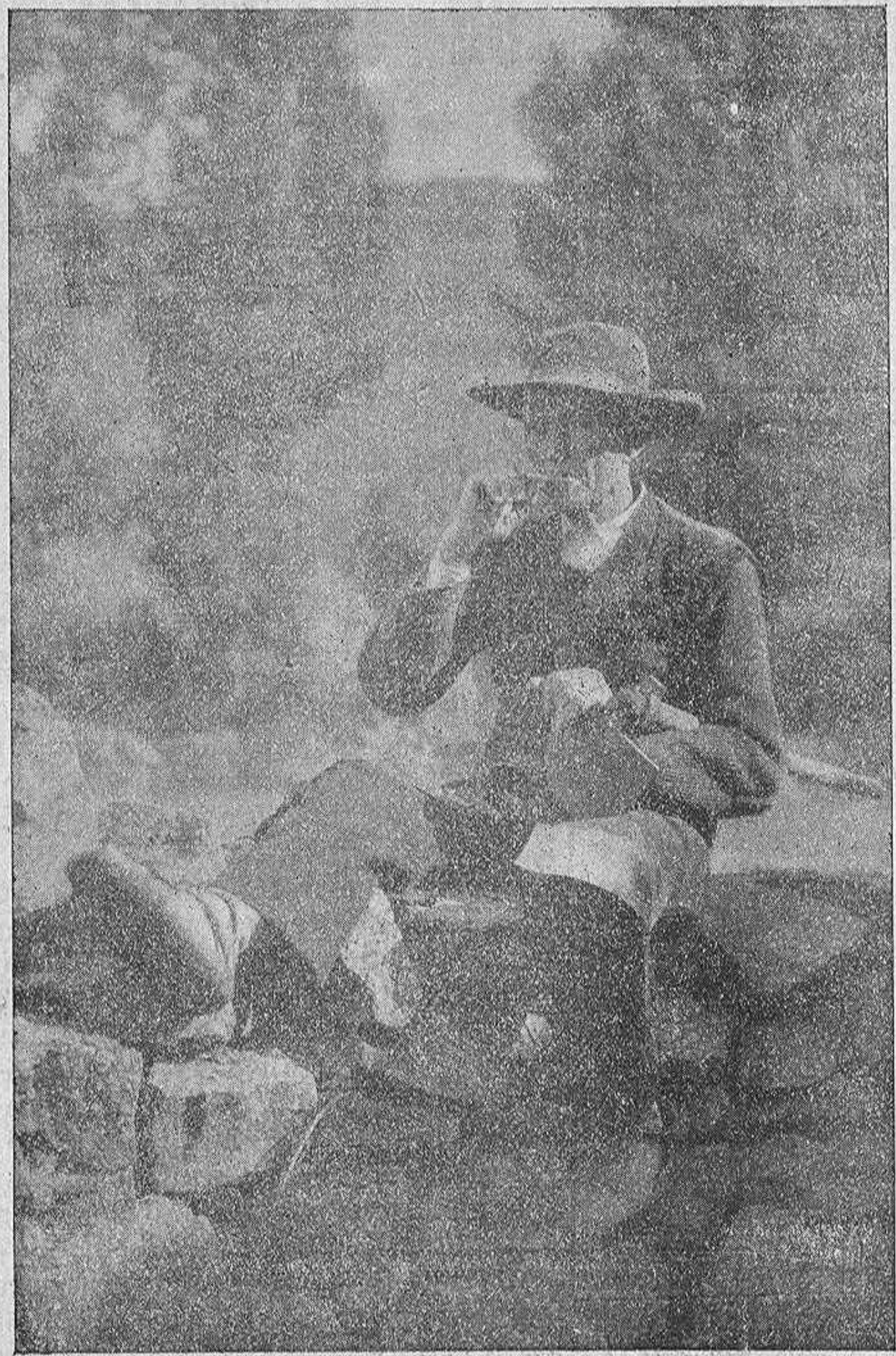
Tipos de la provincia. - Un Modraño