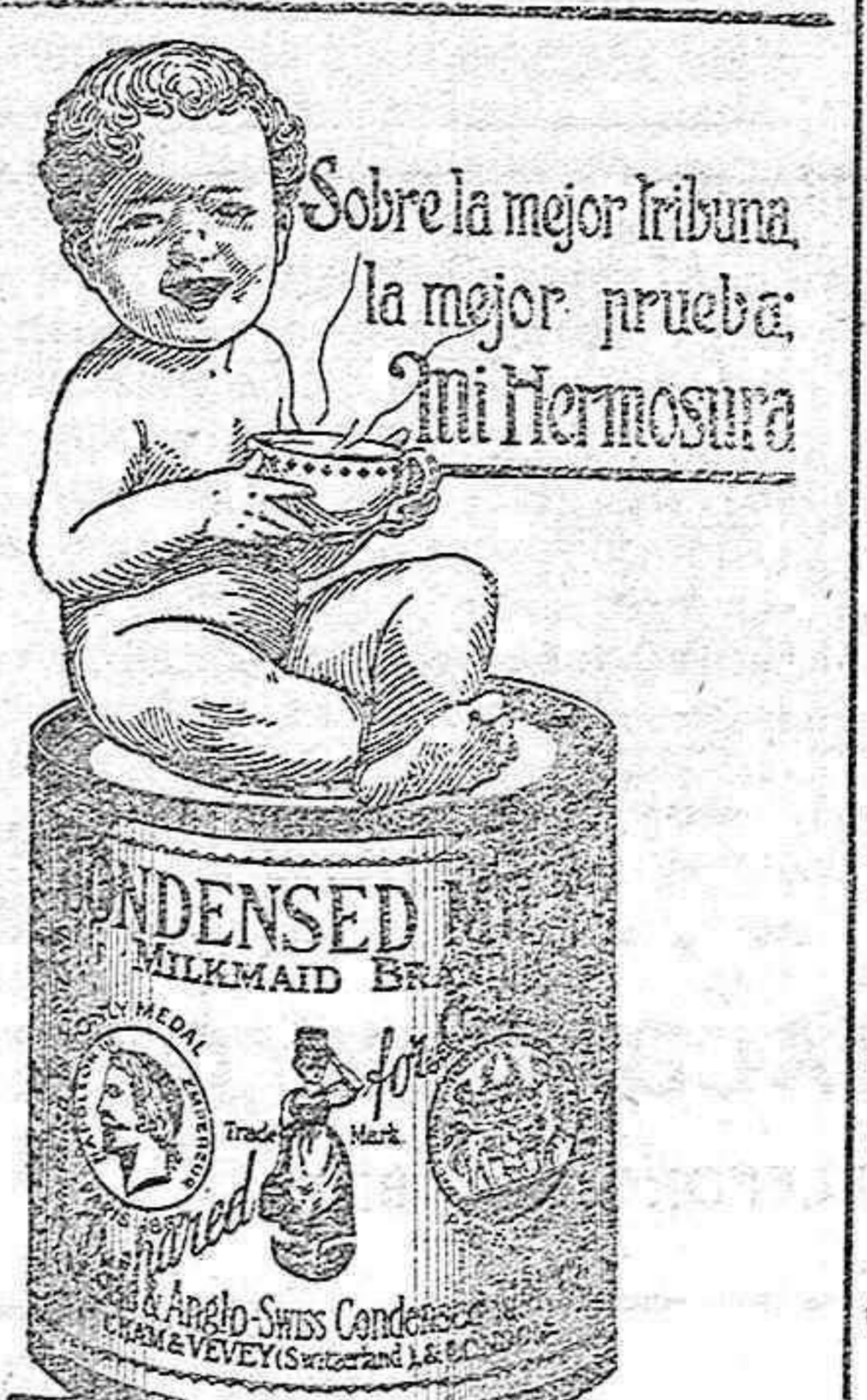
Sobre la mejor tribuna, la mejor prueba: mi hermosura.