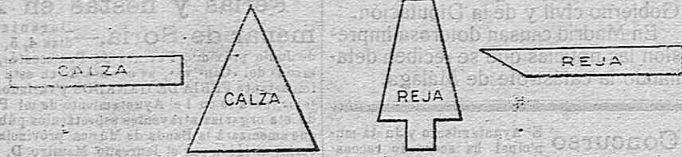
RECORTES Y PLETINAS PARA FABRICACION DE HERRADURAS.