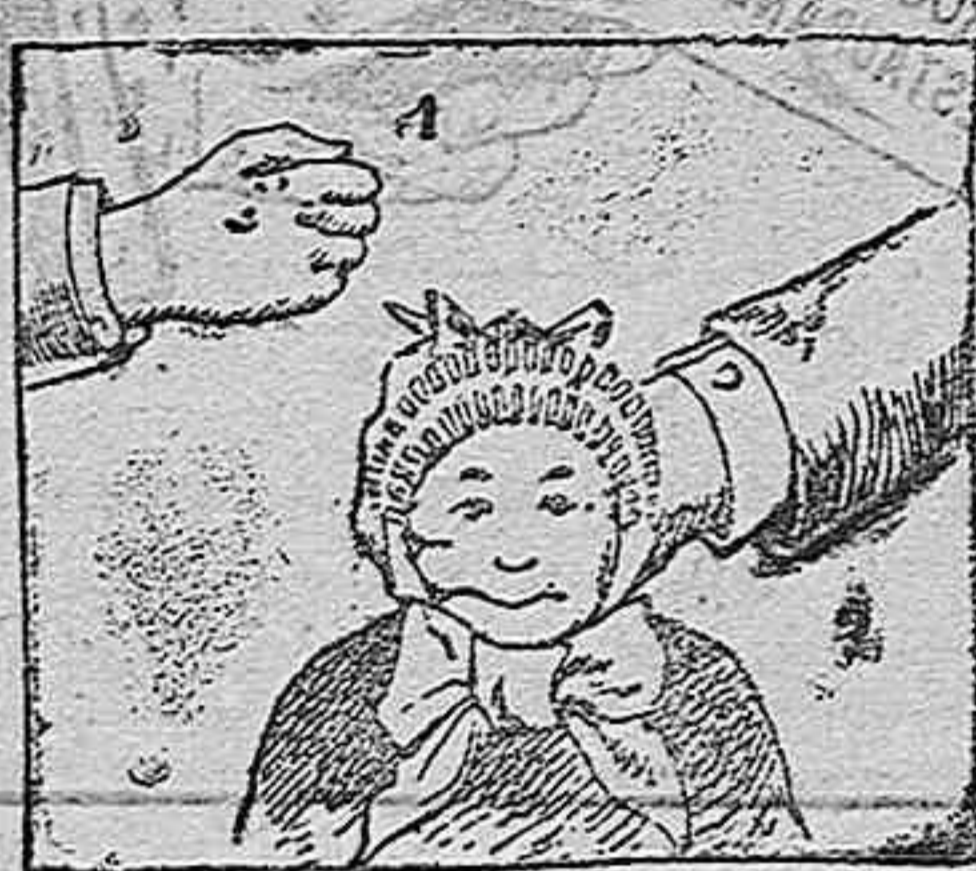
La mano parlante.

Se cierra la mano del modo indicado en el número uno del dibujo, y sobre el dorso se pintan con color dos ojos, una nariz y una boca. Como se ve, el labio y la mandíbula inferior de la cara, así improvisada, vienen á quedar representados en el dedo pulgar. Hecho esto se rodea el puño de los accesorios oportunos, cofia ó mantilla, corbata, etc. La persona encargada por decirlo así de la representación empieza entonces un coloquio con el personaje representado en su mano, teniendo cuidado, cuando figure que habla el citado personaje, de mover el dedo índice, que imitará grotesca y perfectamente el movimiento de los labios.