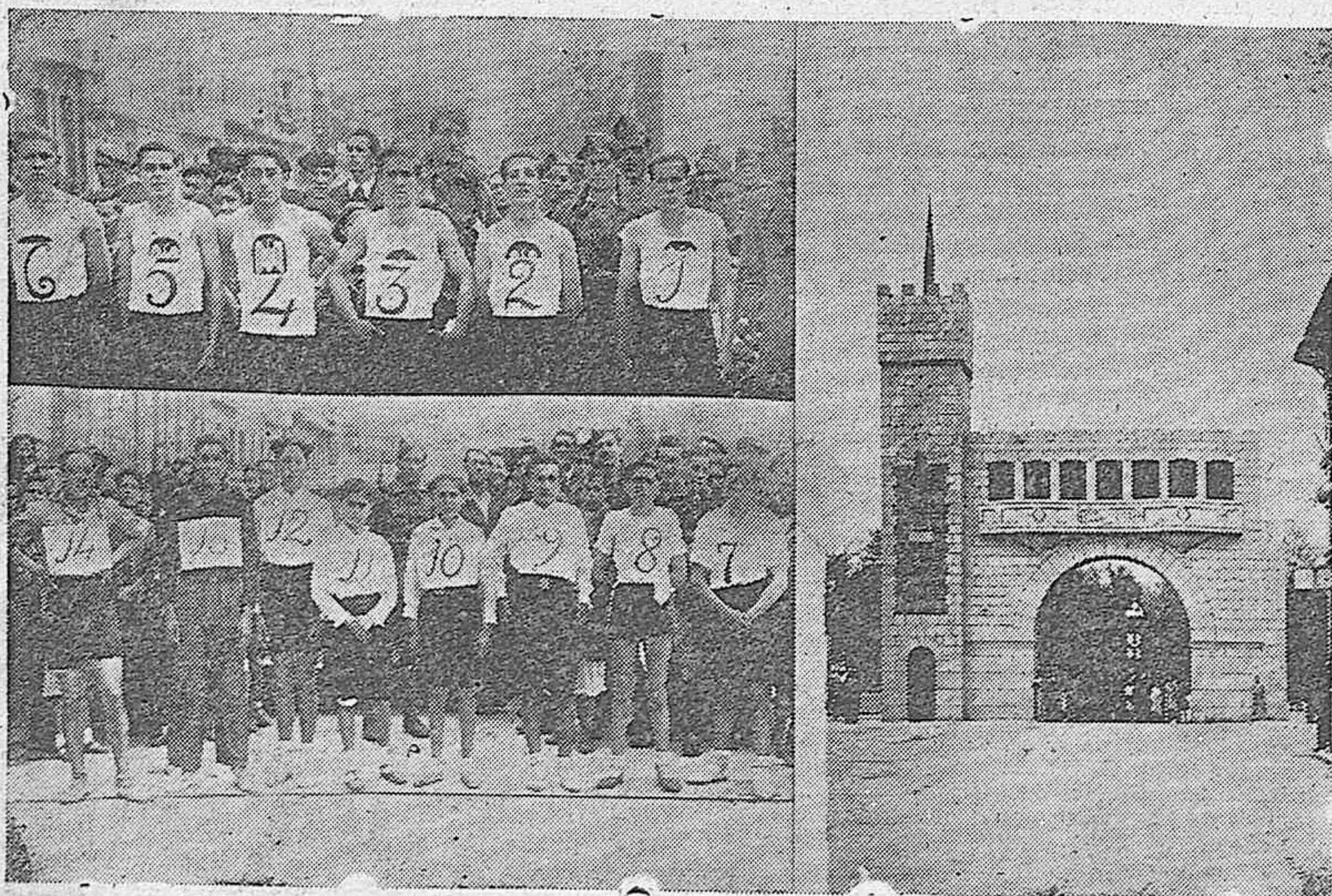
A la derecha, el magnífico arco levantado en las inmediaciones de la Casa de Correos. A la izquierda, los jóvenes que tomaron parte en la carrera pedestre el día de la fiesta de la Victoria.