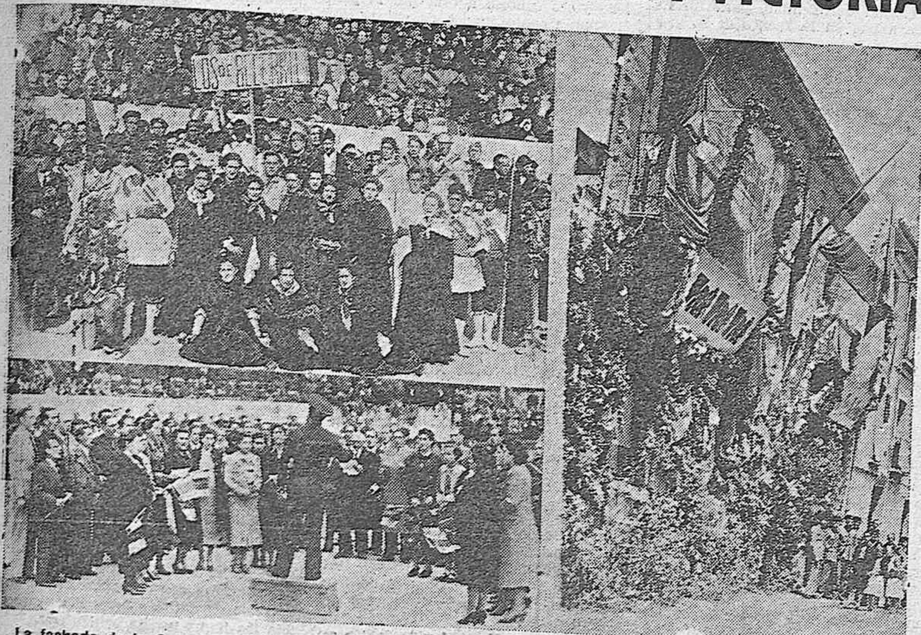
La fachada de la Casa Cuartel de la Guardia Civil, artísticamente adornada. A la izquierda, en la parte superior, los magníficos coros de Becerril de Campos. Abajo, la Coral Palentina dirigida por el maestro Ricis, durante su brillante actuación en la plaza de toros.