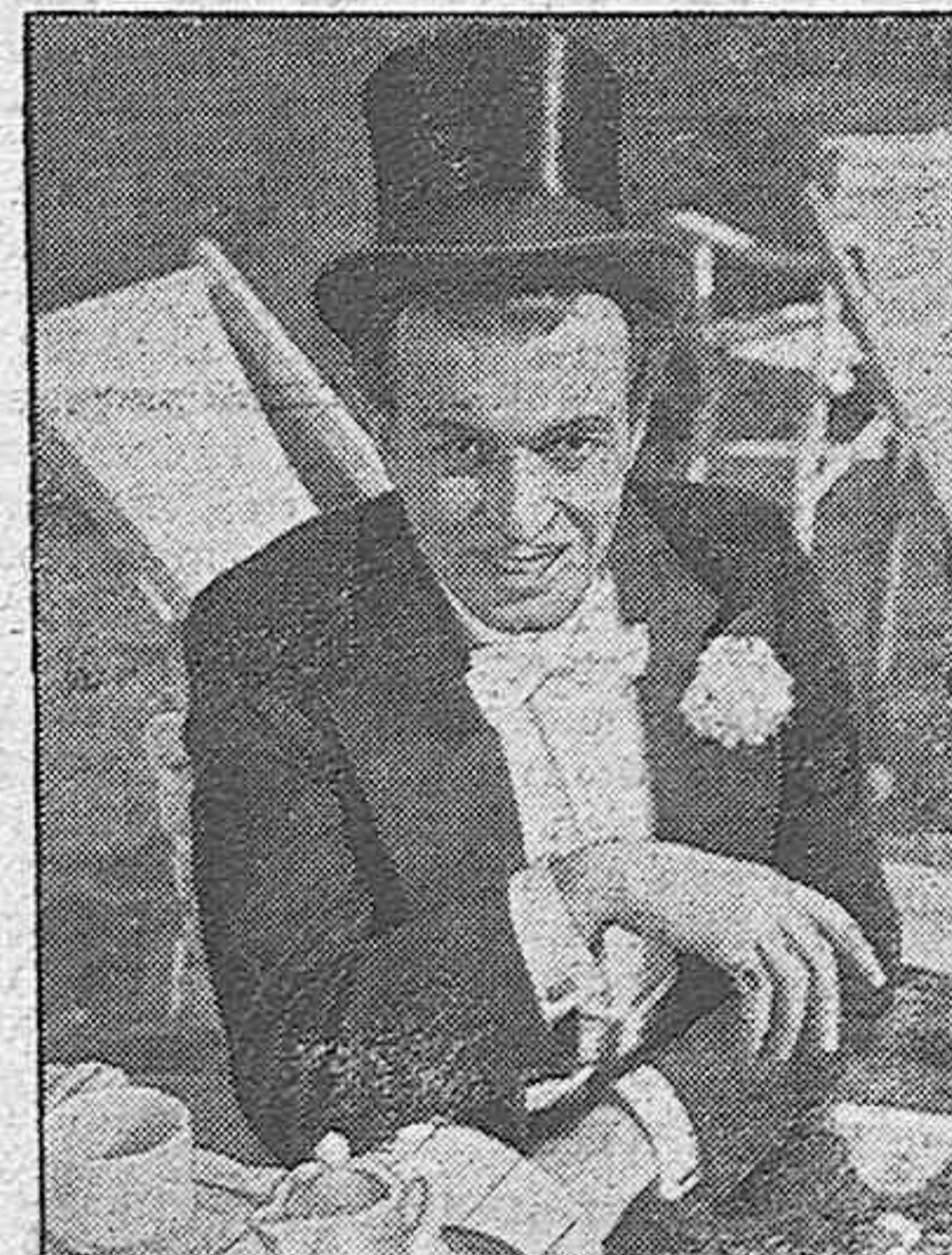
GENIAL INTERPRETE DE ALGUNAS PELICULAS SENSACIONALES QUE ESTA RODANDO ACTUALMENTE LA «TOBIS FILMS-HISPANIA»

En Berlín se ha estrenado la película de Tobis «El cuarto no viene», que se rodó bajo la dirección de M. W. Kimmich.