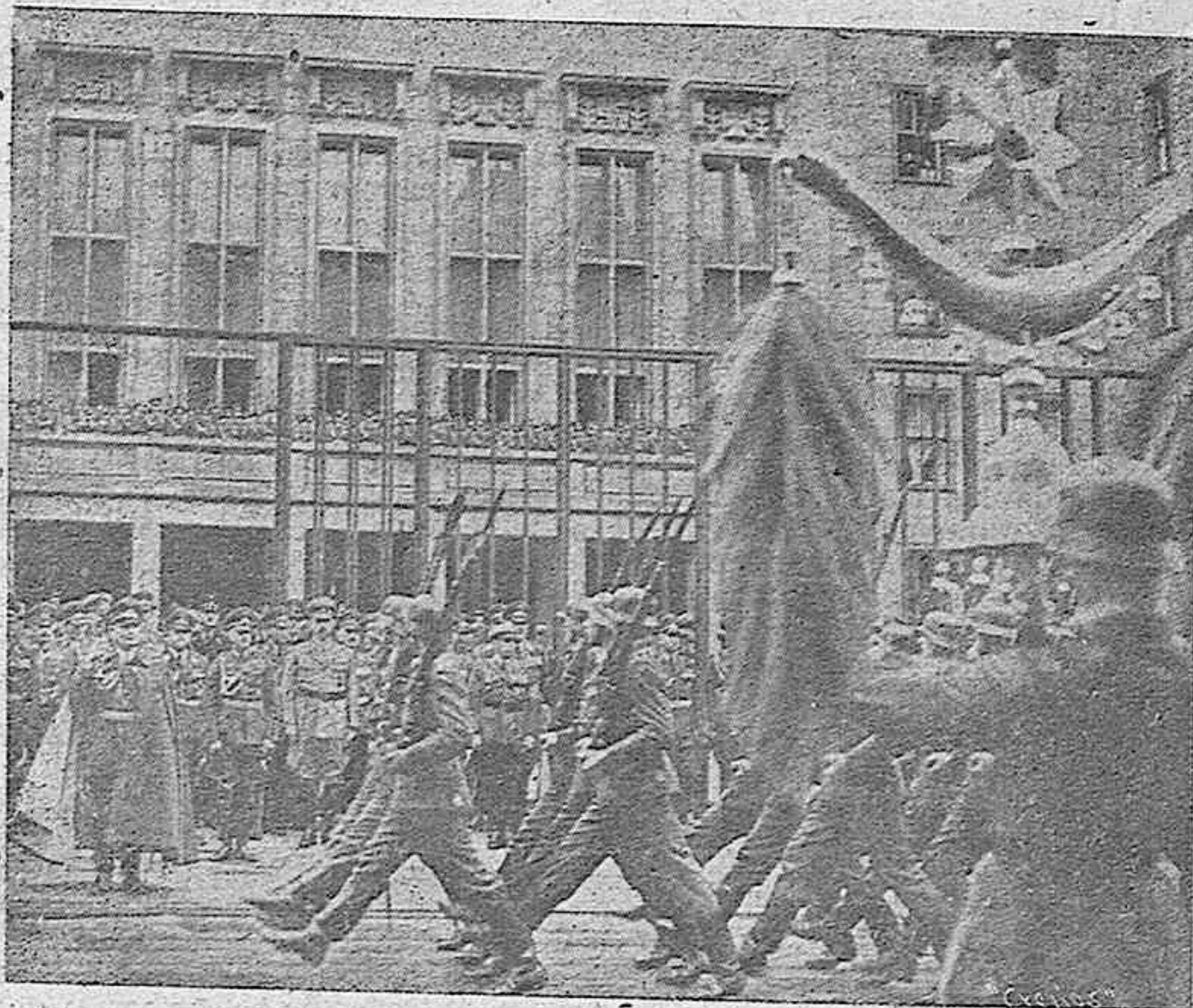
CON MOTIVO DEL 50 ANIVERSARIO DEL FUHRER SE CELEBRO EN BERLIN UN GRAN DESFILE MILITAR LAS FUERZAS ALEMANAS DESFILAN DELANTE DEL MARISCAL GOERING