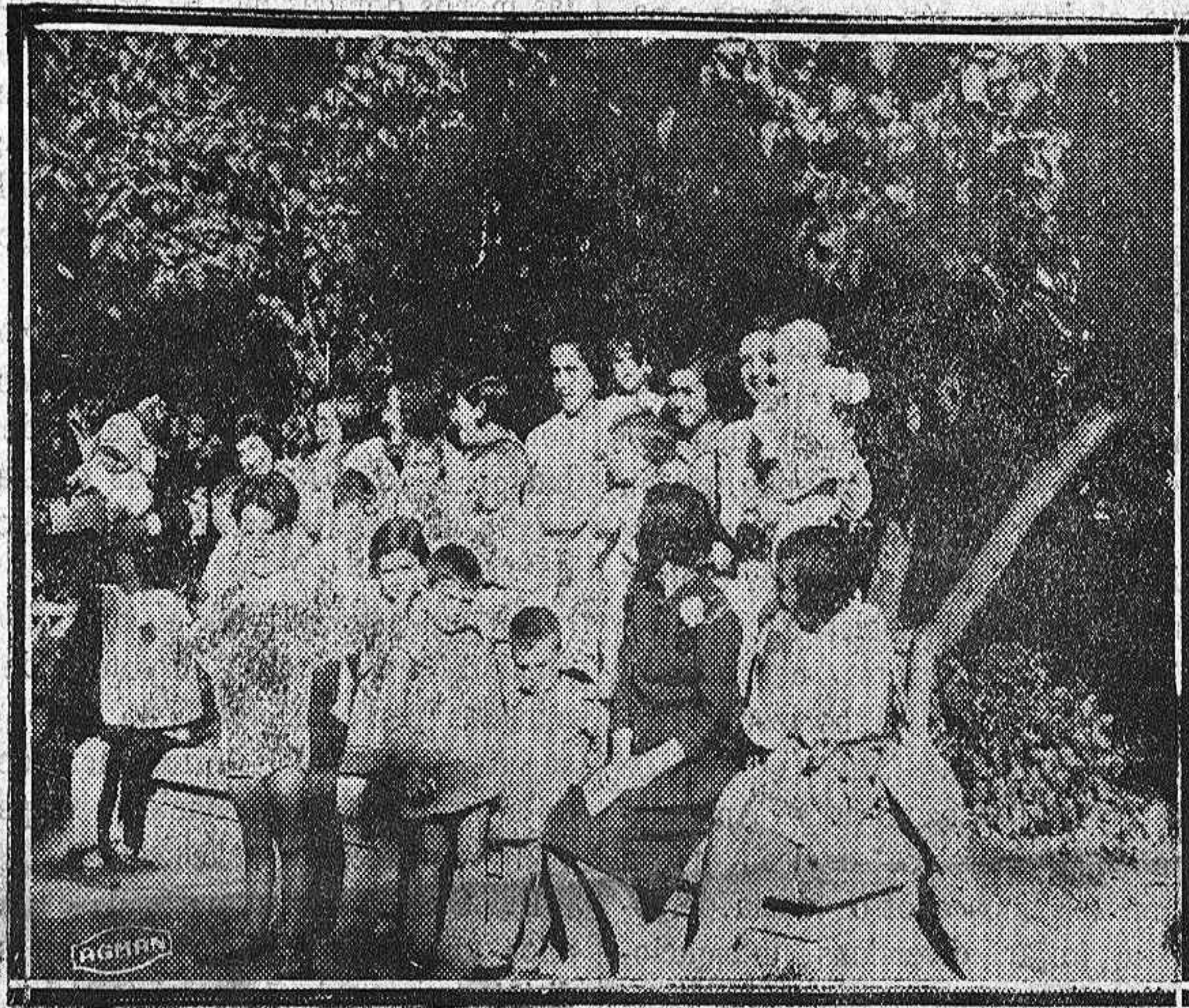
Verano palentino. — En el Saló

Es idéntico el problema, e idéntica también la disyuntiva.