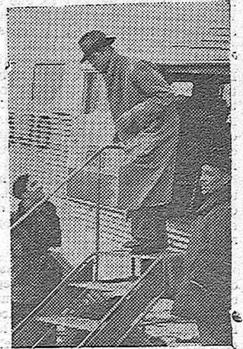
Esta «foto», recoge el momento en que el famoso boxeador Schmeling desciende del avión que le condujo a Madrid.