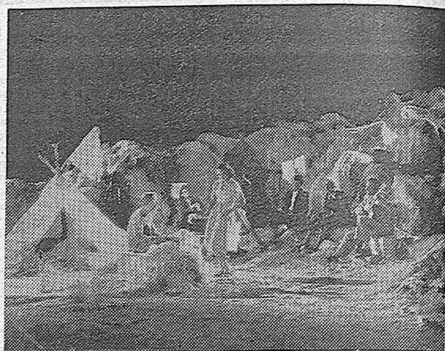
HUMOR Y OPTIMISMO CARACTERIZAN LA REALIZACION DE ESTE «FILM» ESPAÑOL «LOS CUATRO ROBINSONES»