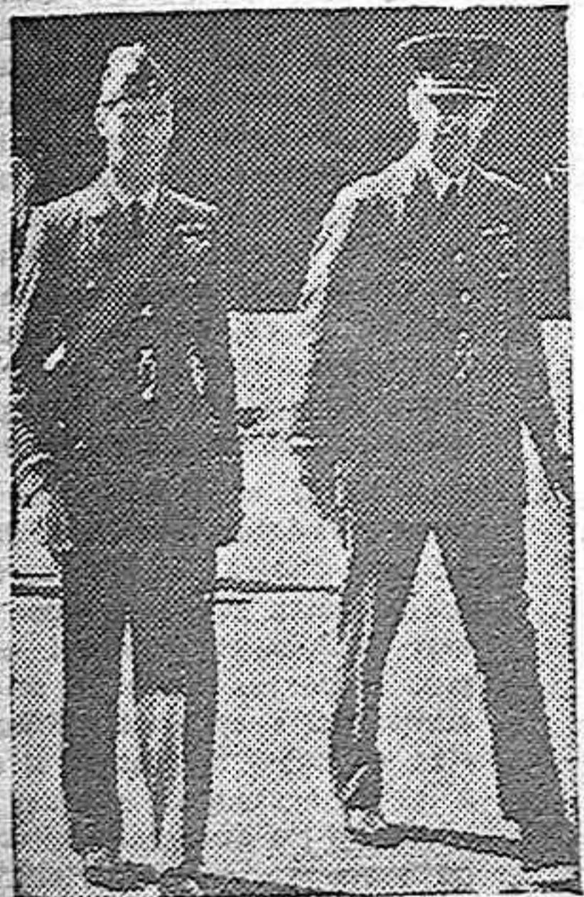
El Rey Jorge VI de Inglaterra, en su visita a uno de los aeródromos militares de la Gran Bretaña