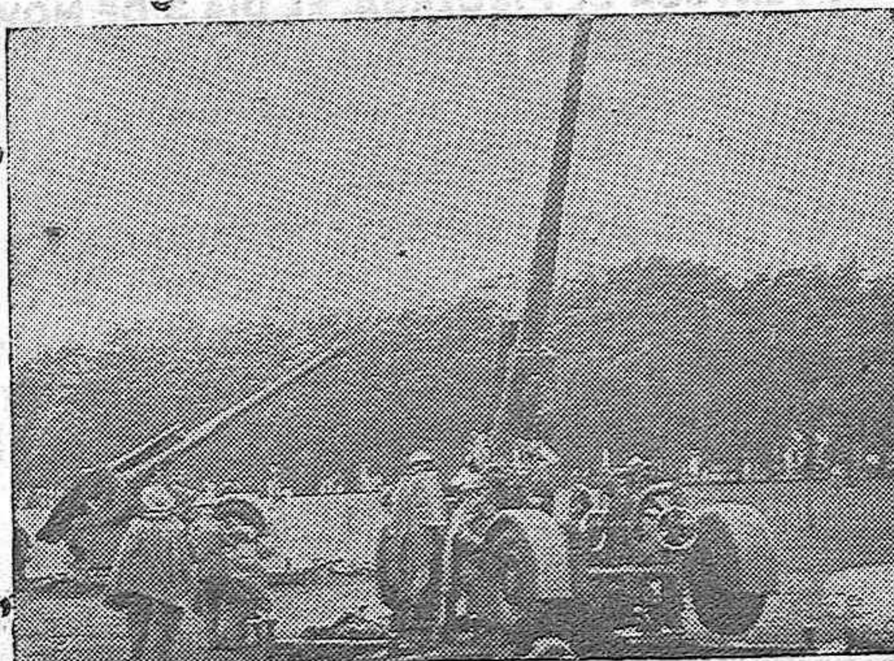
La “foto” recoge un emplazamiento de baterías antiaéreas, destinadas a la defensa contra aviones en Londres