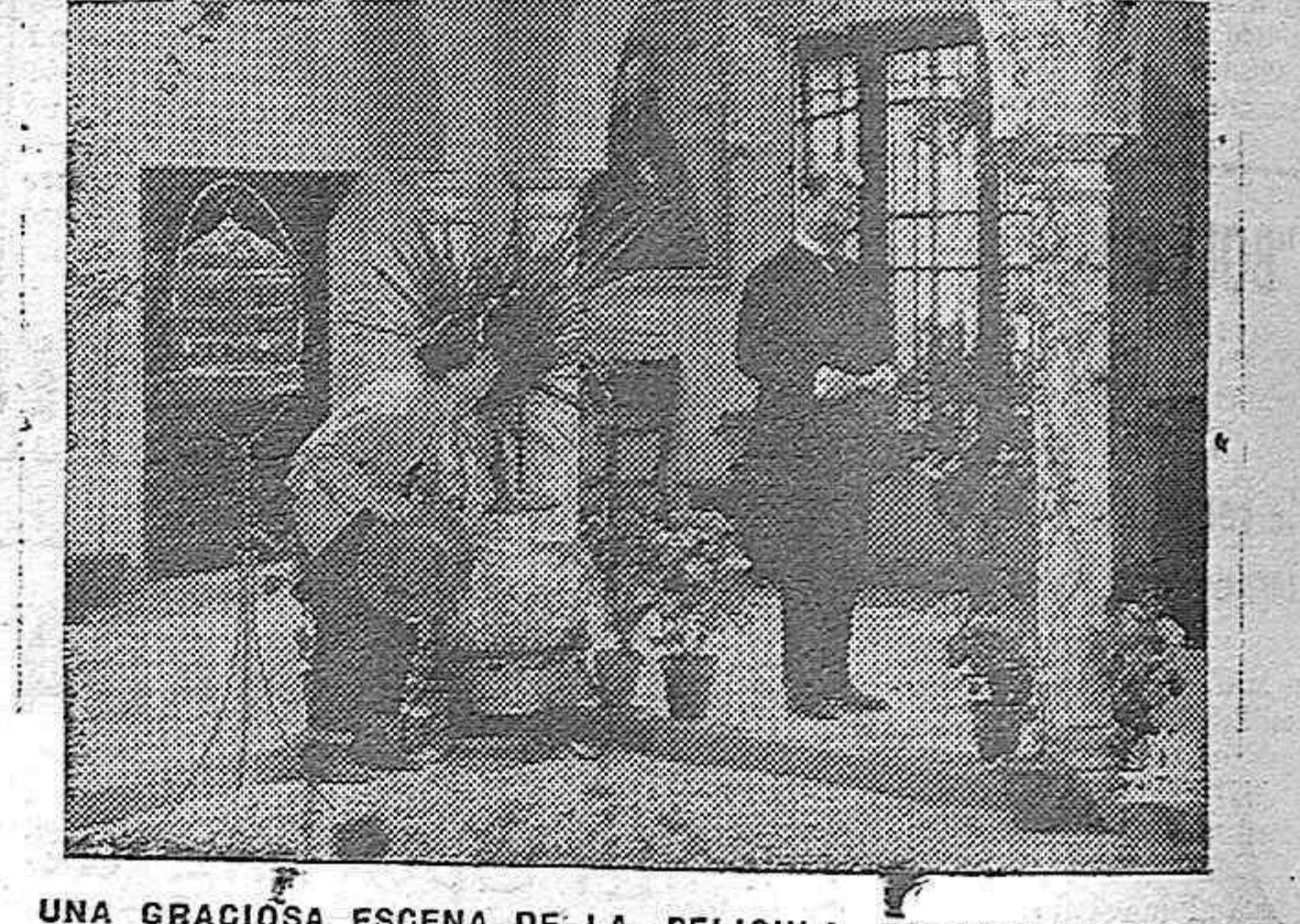
UNA GRACIOSA ESCENA DE LA PELICULA ESPAÑOLA «EL GENIO ALEGRE»

«EL GENIO ALEGRE», llevado a la película. Después de la grave convulsión pasada, todo en España, nuestra una decidida tendencia a renovarse y superarse, y por encima de este noble deseo, común a todos los pueblos con espíritu, España pone la ambición de que esa superación buscada se base necesariamente en la innata condicional racial y racial. El film hispano tendrá que ser también nacionalista.