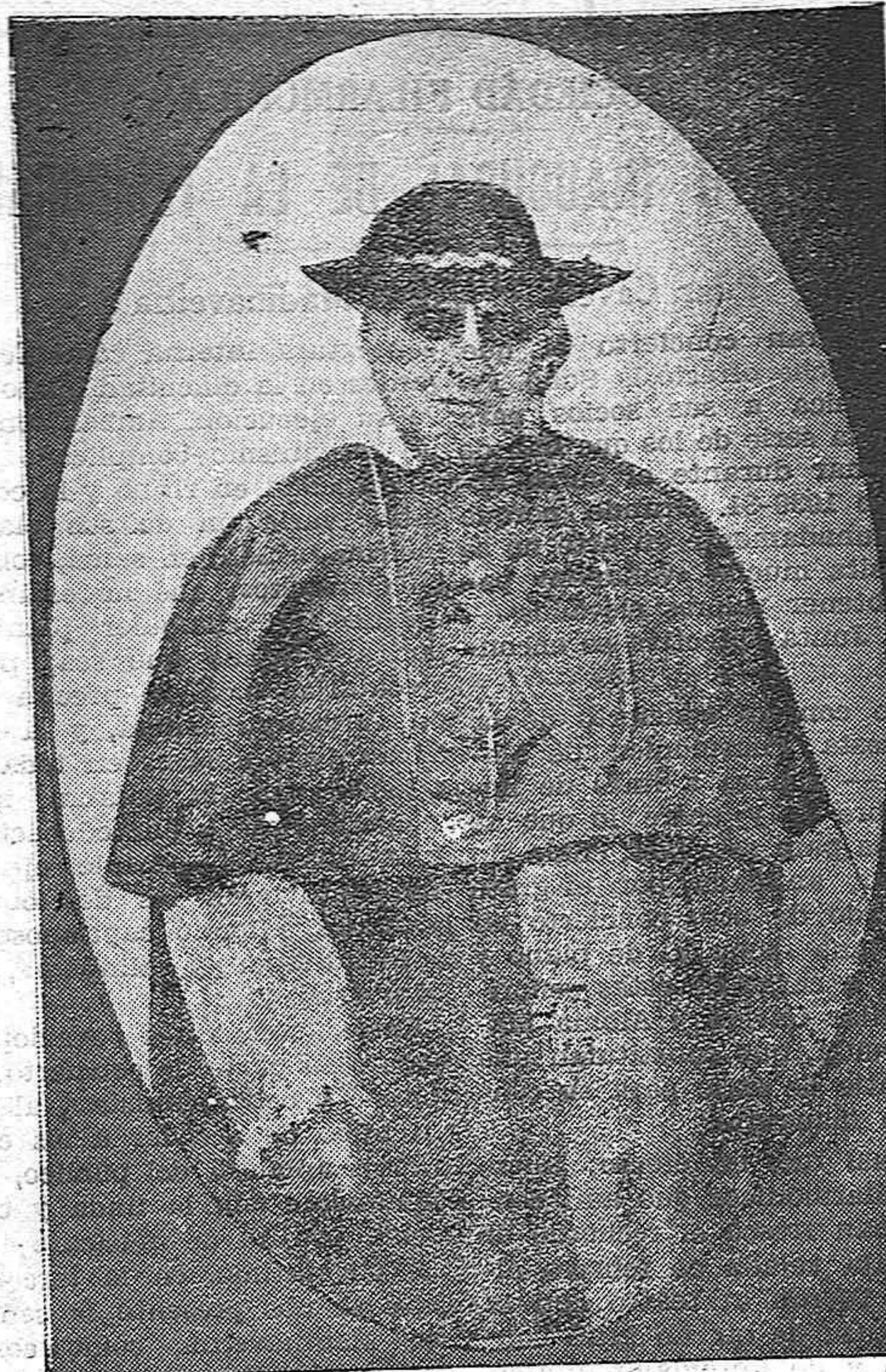
El Cardenal Casanova, arzobispo de Granada, que falleció ayer en Zaragoza