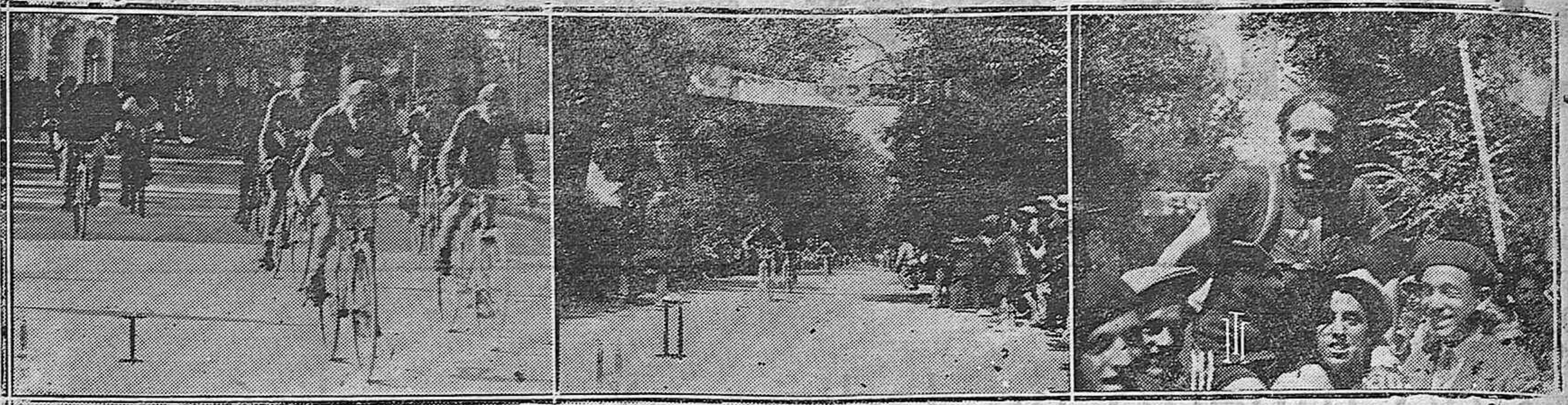
Los corredores en el momento de salir de la meta