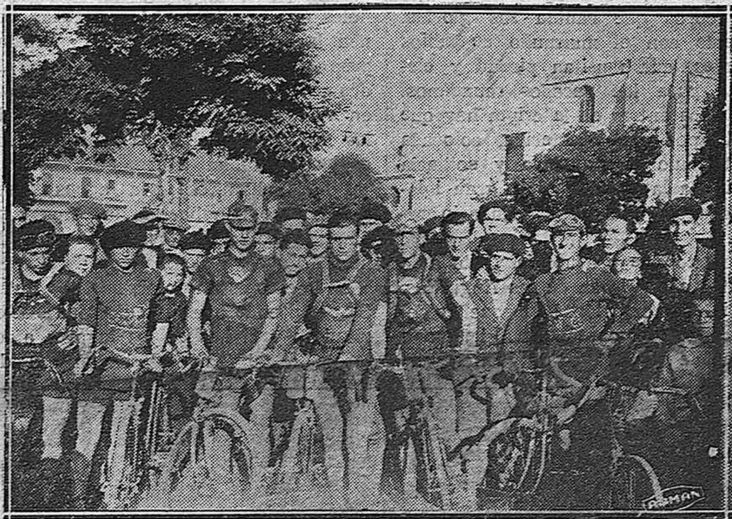
Corredores que tomaron parte en la carrera de la vuelta a La Nava

quién que convierte al autor en semi-diós, y cuenta en una serie de volú-