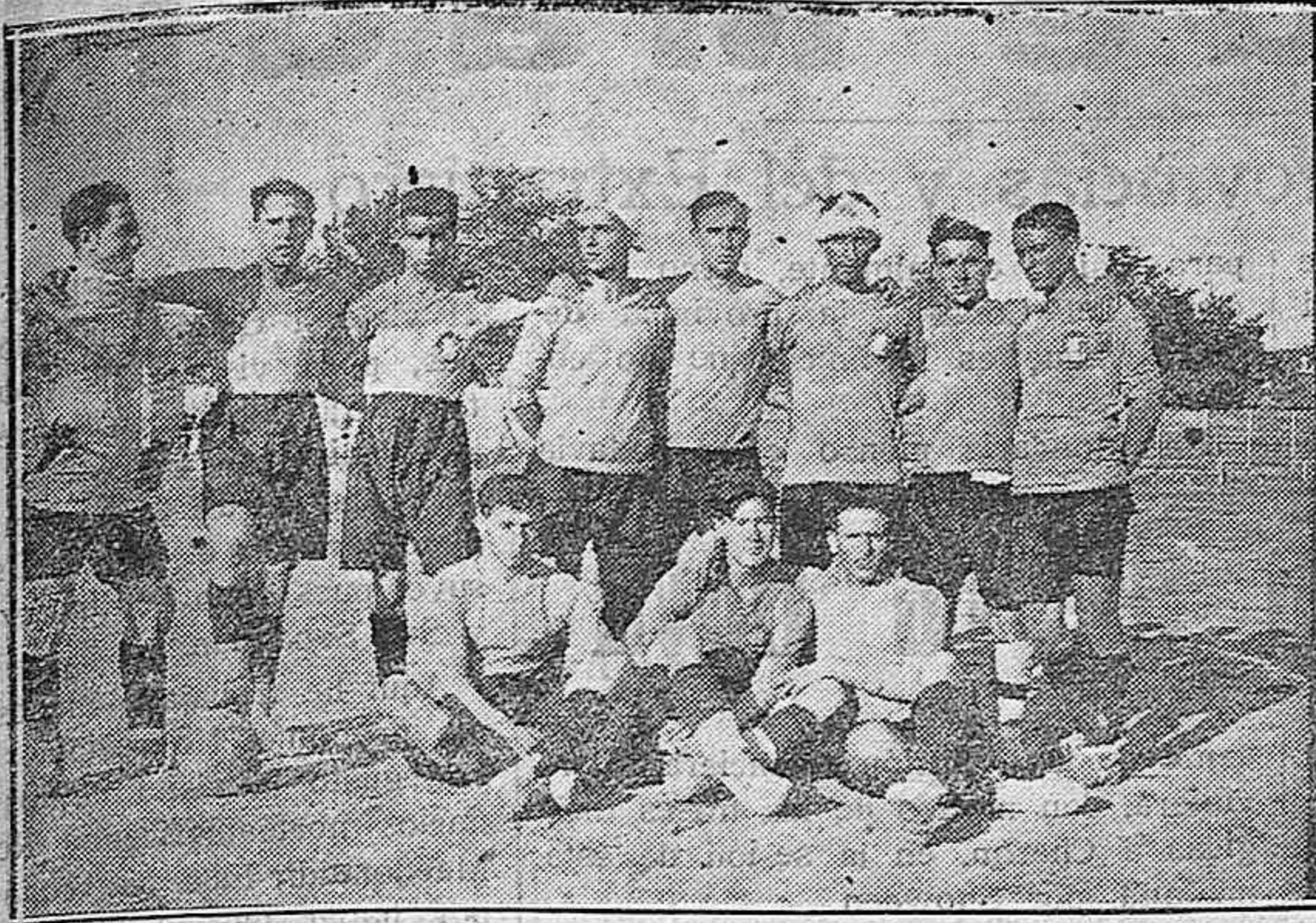
Equipo de Palencia