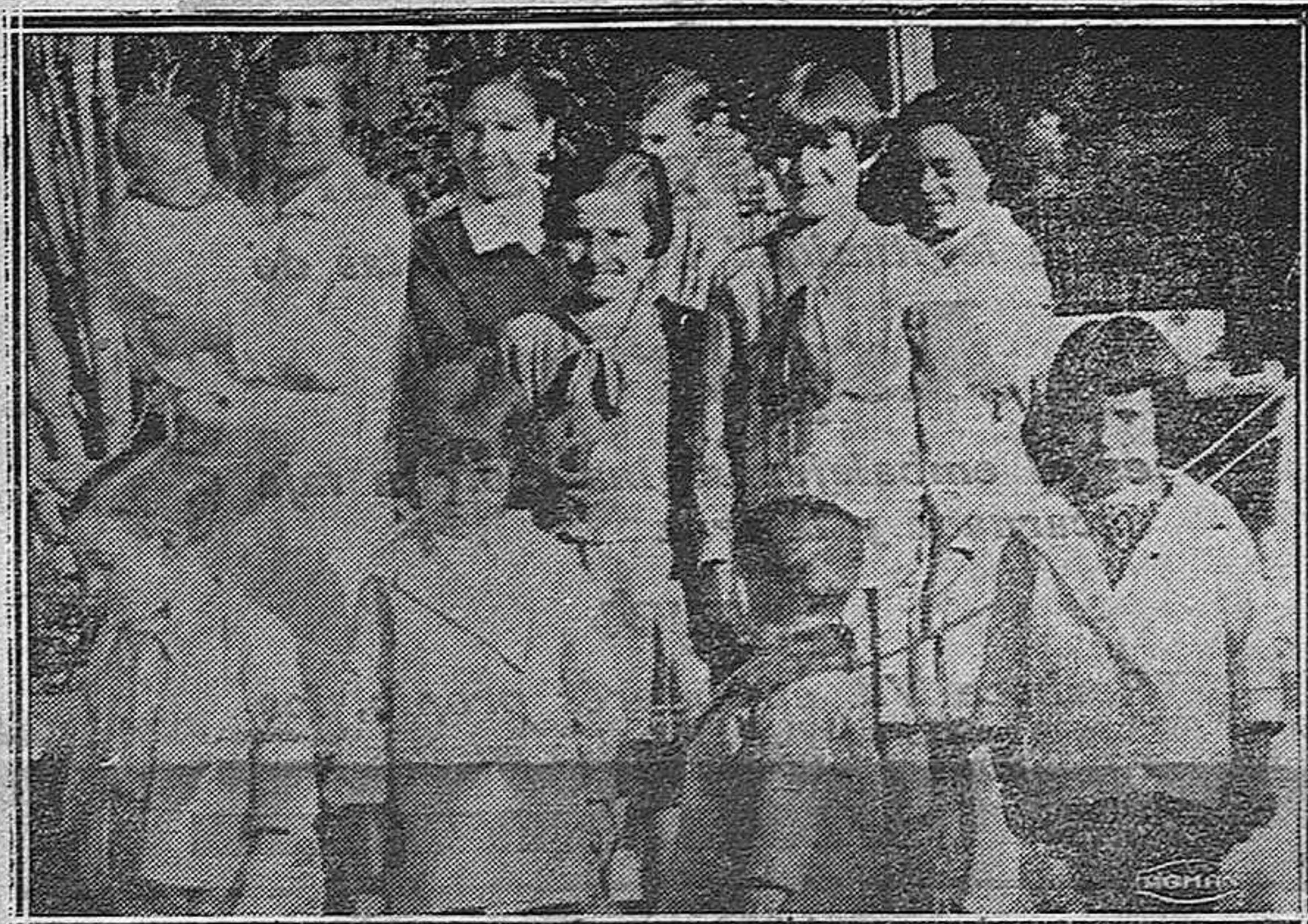
Temas veraniegos.—Al declinar la tarde salen los niños a correr por los jardines.