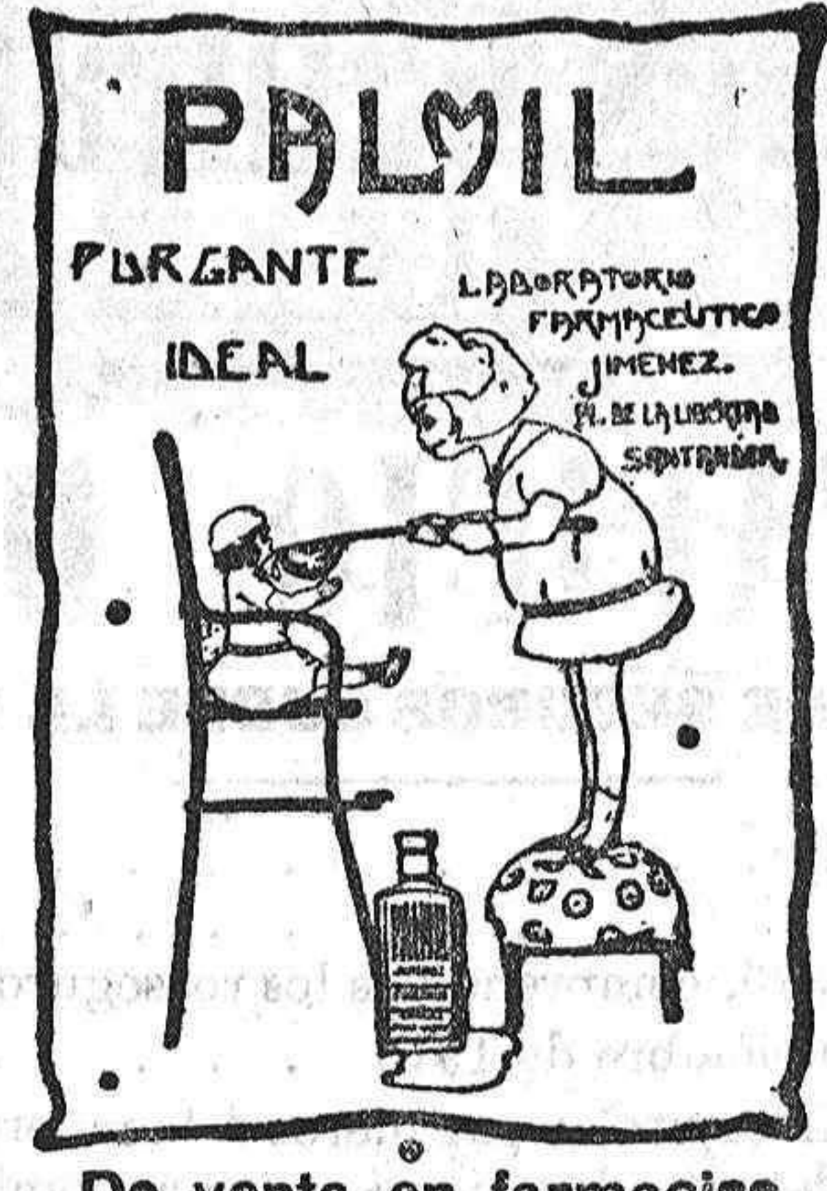
De venta en farmacias y droguerías.