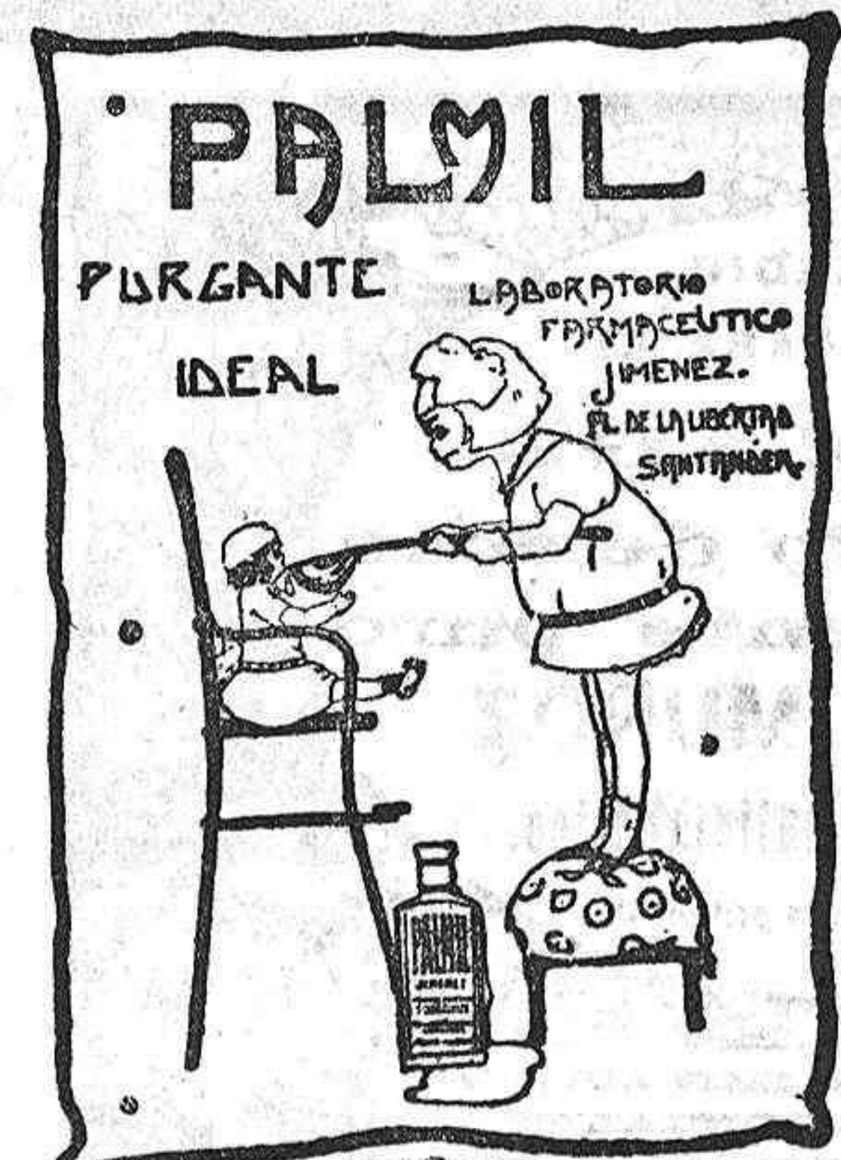
De venta en farmacias y droguerías.

En Madrid, en nuestro Gabinete Ortopédico, Carrera de San Jerónimo, 37, principal, desde donde enviaremos gratis a médicos y a particulares, nuestro libro sobre HERNIAS.