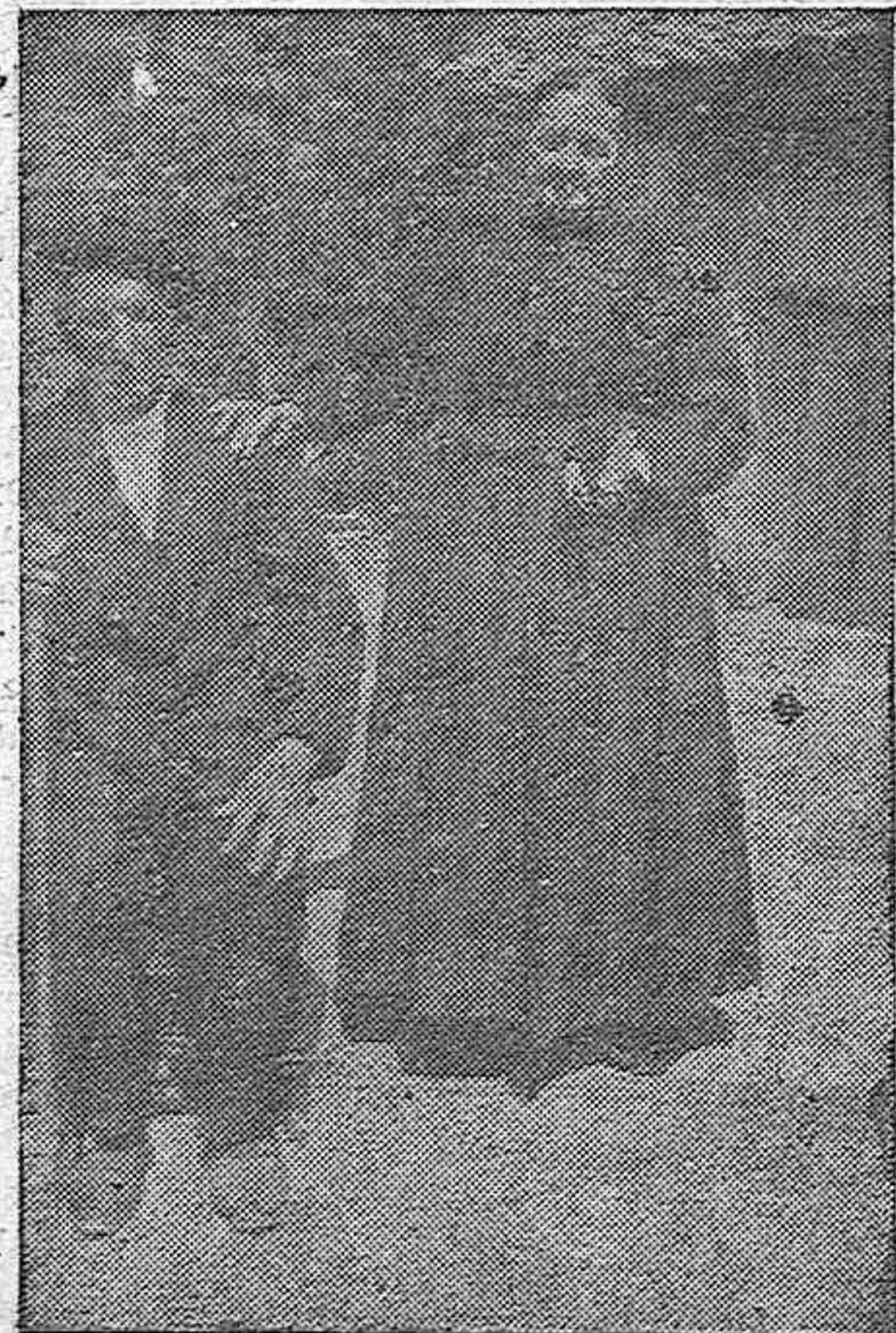
Los padres del Excmo. Sr. Obispo de Teruel, en la puerta de su casa, de Buenavista de Valdeavia, donde aquél nació