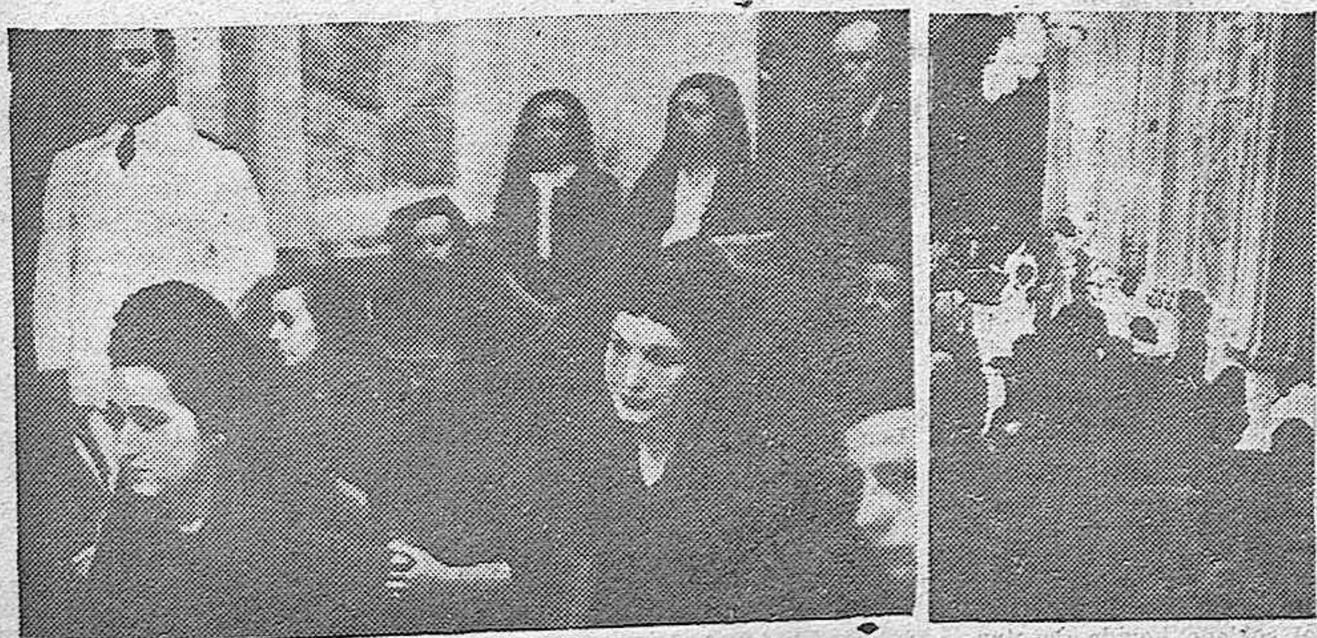
Es el Ministerio de Marina en Madrid, se ha celebrado una misa en sufragio de los asesinados por los rojos en el «España número 3». El momento de alzar a Dios y un grupo de familiares de los caídos por su Religión y su Patria.