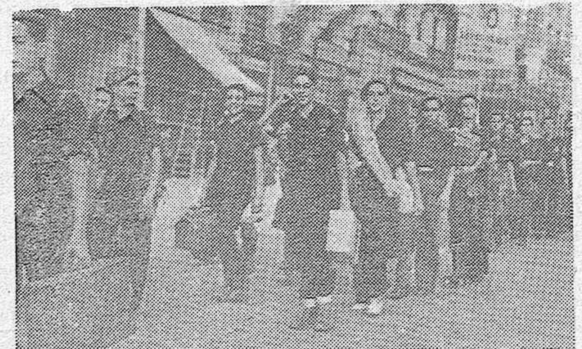
Momento en que un grupo de muchachos de las Organizações Juveniles de Madrid marchan hacia la estación donde tomarán el tren que los ha de conducir al Campamento santanderino de Ontañón.