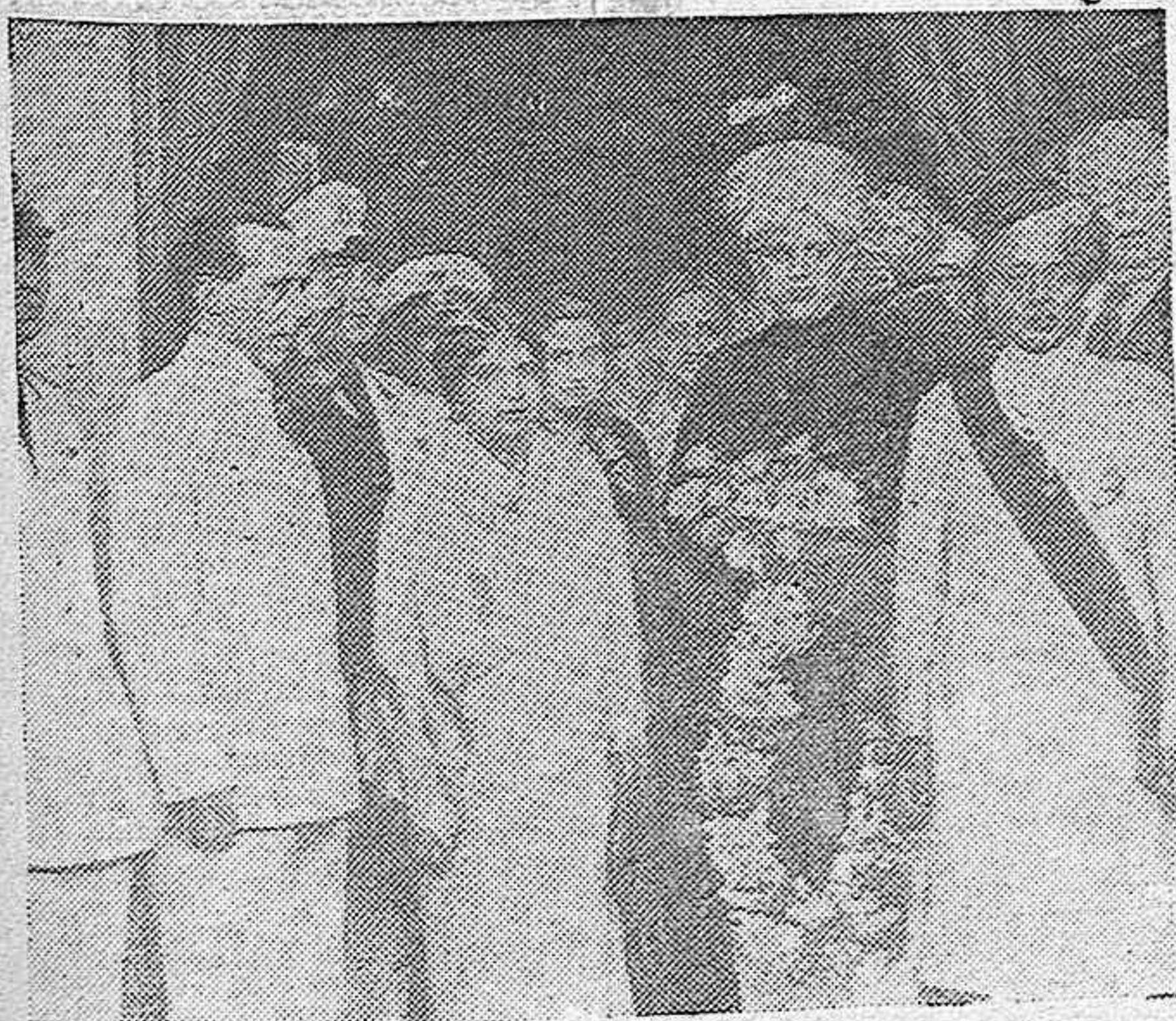
Llegada a Roma del Príncipe de Mysore (a la derecha), acompañado de su esposa, su hijo mayor y su fastuoso séquito.