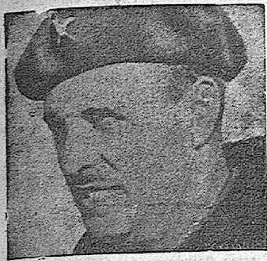
El general don José Solchaga que se ha hecho cargo del mando de la Séptima Región Militar.