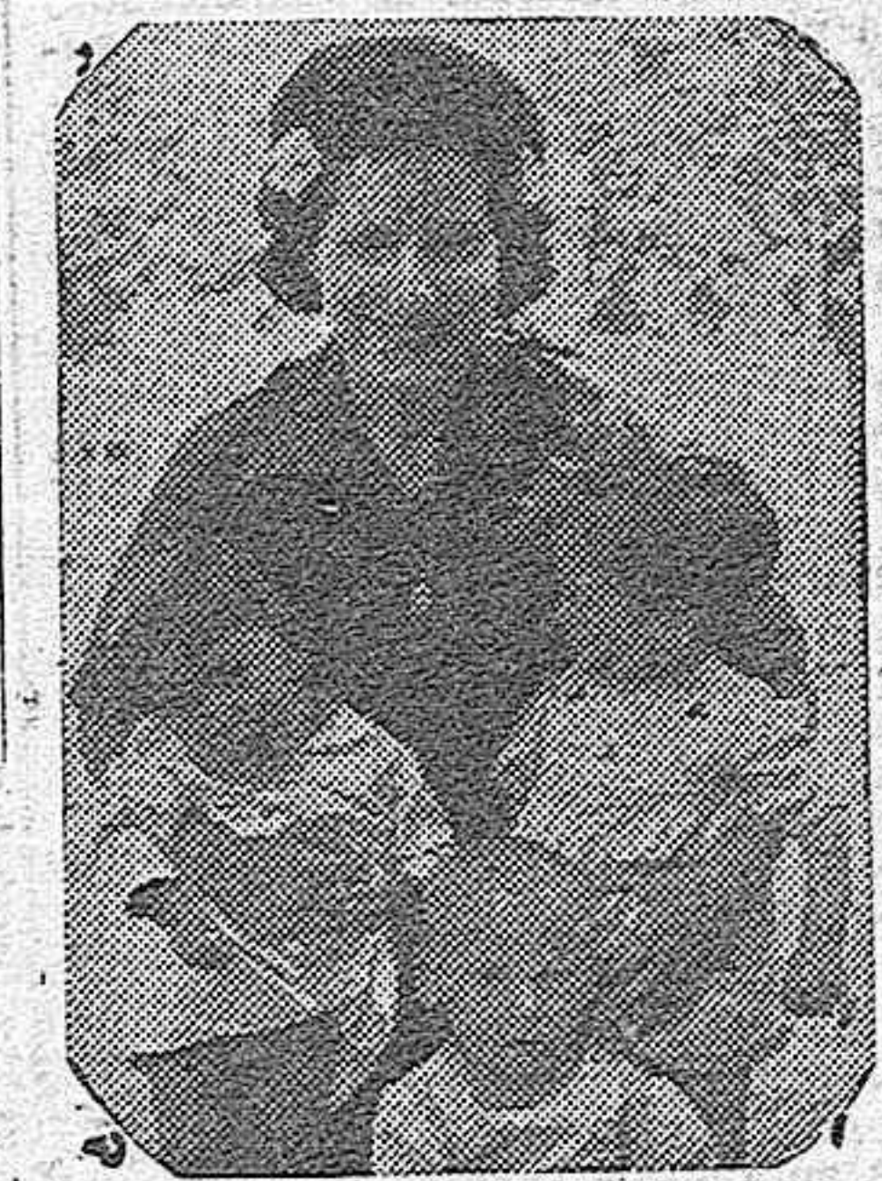
Esta bella señorita de «Auxilio Social» de Madrid sostiene en sus brazos a tres pequeños que ha tenido a bien ahijar.