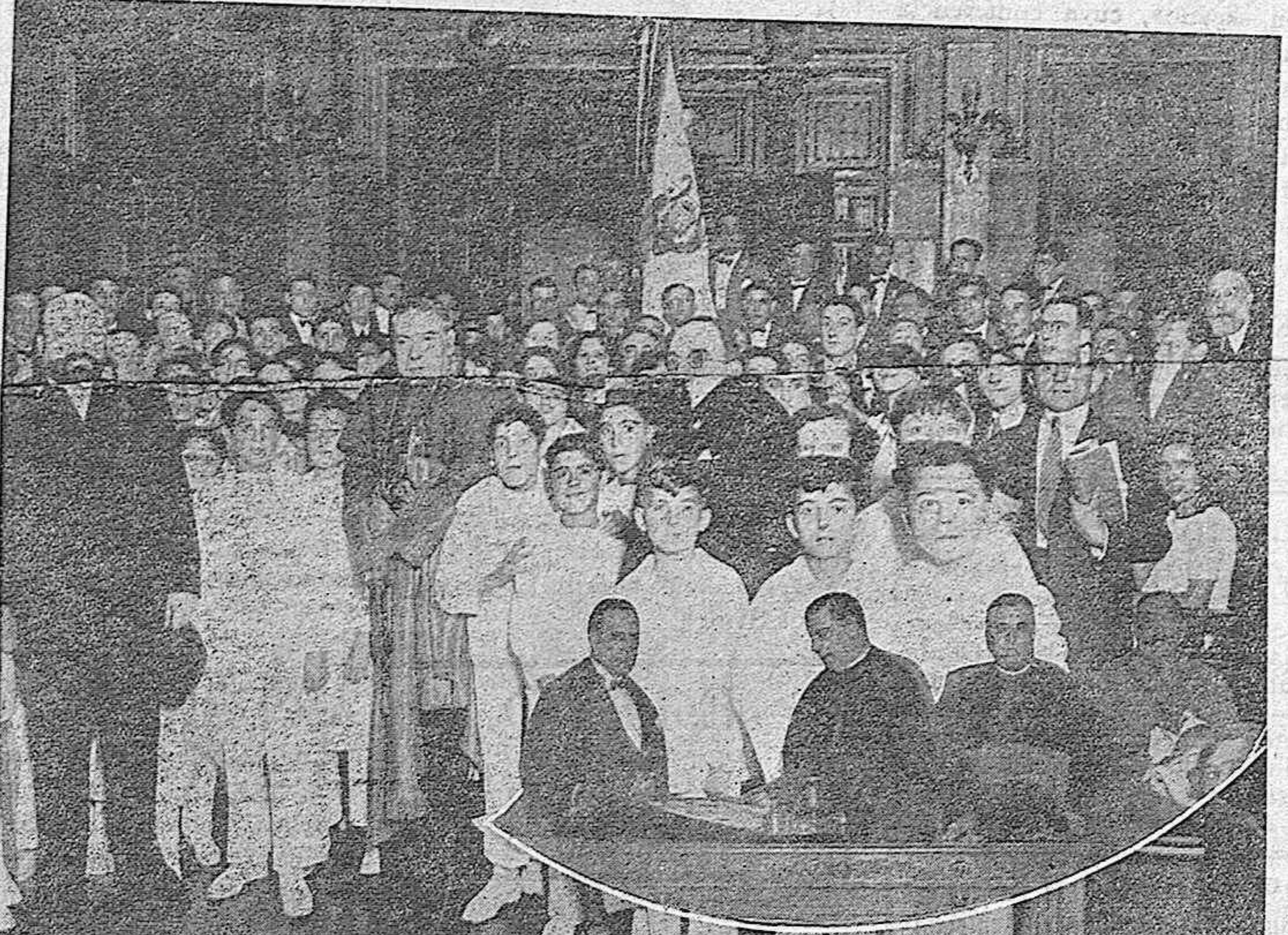
Masa Coral de Santander que dará un concierto el próximo sábado en la Plaza de Toros (Fotografía obtenida en la capital de la Montaña).