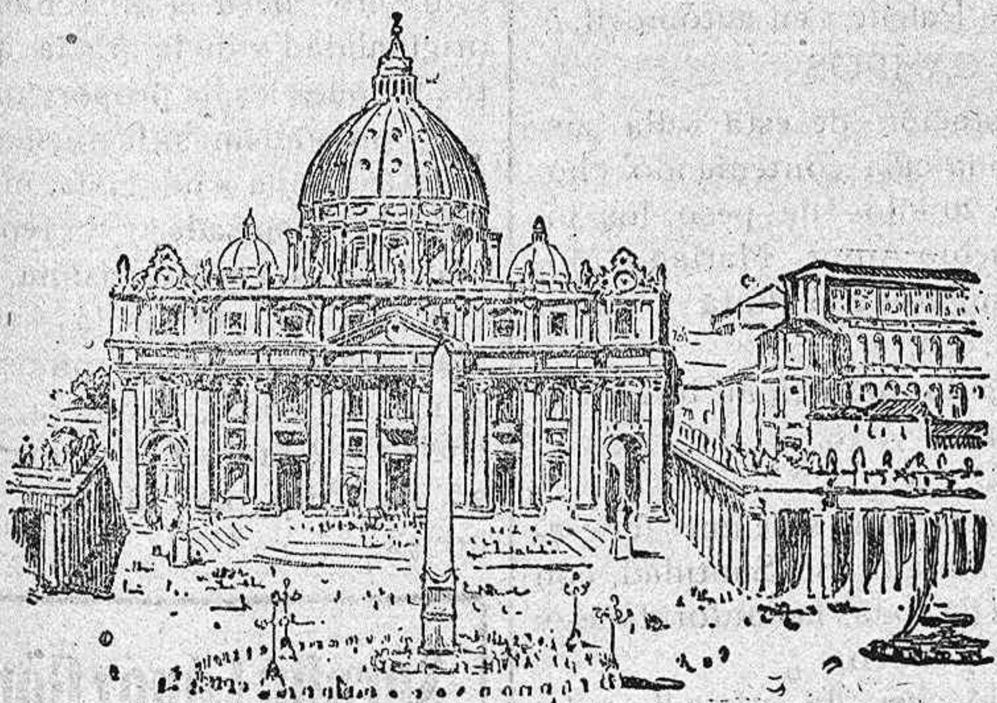
Exterior de la Basílica de San Pedro, donde provisionalmente ha recibido sepultura Benedicto XV

La conferencia, que es esperada con gran interés entre los profesionales y numerosos amigos del distinguido médico, tendrá lugar el próximo día 9 de los corrientes.